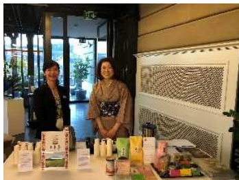
日本茶ブースでお茶を振る舞う日本茶大使