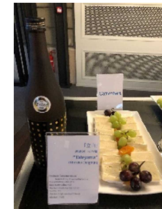
日本酒とチーズのペアリング(3種類)