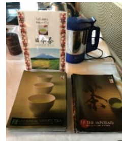
農水省日本茶パンフレット