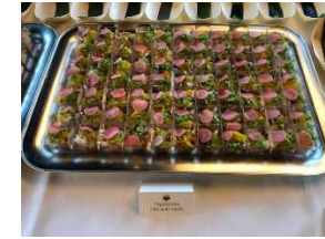
ベジタリアン向けの チラシ寿司も提供