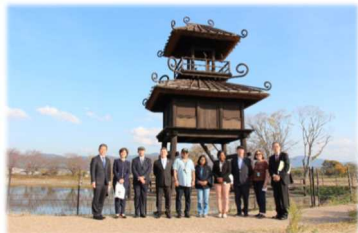
唐古・鍵遺跡史跡公園