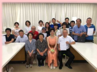
トルコ語講座に参加してくれた皆さんで 記念写真撮影