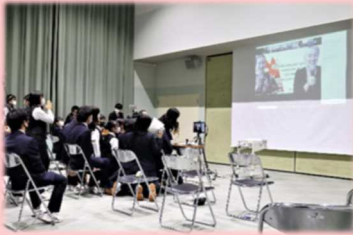
姉妹校提携に向けた交流 (意見交換会風景)