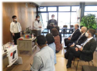
事業者によるプレゼンテーション