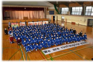
ホストタウン相手国ガーナへの 応援メッセージ

野 口英世博士は福島県猪苗代町で生まれ、ガーナの地で終焉を迎えました。これまでもガーナ共和国の大統領が猪苗代町を訪問するなど、交流を重ね、東京オリンピック・パラリンピック競技大会においても猪苗代町はガーナのホストタウンに登録され、同国を応援しています。その猪苗代町で、今回町民の手で一体どのような「花」が咲いたのでしょ