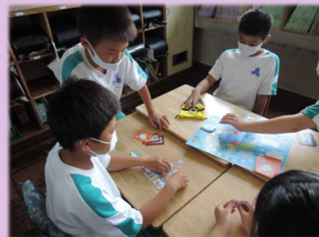
ボードゲームを使った授業の様子