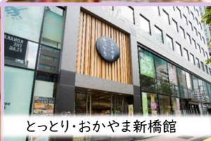
とっとり・おかやま新橋館