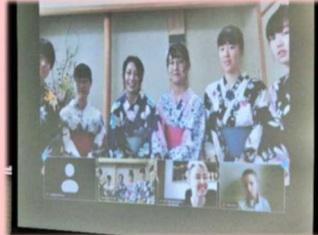
姉妹校提携に向けた交流 (文化紹介風景)

世 界の人々から尊敬されるグローバルシチズンとしての日本人の育成」を教育目標に掲げる北海道札幌国際情報高等学校では、コロナ禍においても、ロシアの学校とICTを活用してオンラインでつながり、文化紹介や演奏交流などといった充実の交流が展開されてきています。「異文化を身近に感じられた」と新たな交流の形にも価値を見出された学生の皆さん。今後の更なる交流の深化、進展に期待です。