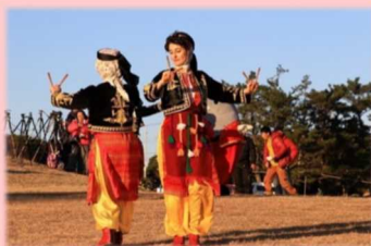
串本町の「本州最南端の祭り」で トルコの民族衣装をまとい、 トルコの民族舞踊を踊った