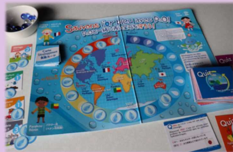
水の大切さを学ぶボードゲーム