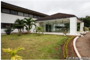
ガーナ野口記念医学研究所

JICAは、過去約50年、技術協力・無償資金協力を通じ、同研究所を中核研究拠点として整備。国外の研究機関等との共同研究を推進。ガーナ国内の新型コロナ感染症のPCR検査数(約2万件/週)の最大約8割を担った。西アフリカの周辺8か国をネットワーク化し検査体制を技術支援。 研究・早期警戒体制の強化 を推進