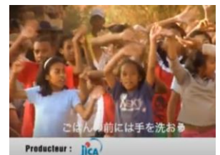
海外協力隊作成の手洗いの啓発ビデオ(マダガスカル)