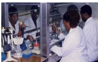
同研究所における50年近くの研究者・人材育成