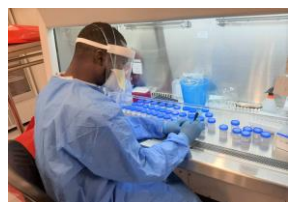
PCR検査を実施する同研究所員