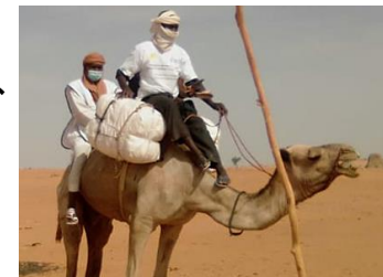
感染症対策の医療品の配布 (グローバルファンド)

我が国はグローバルファンドに対し、2020-2022年に8.4億ドルの拠出をプレッジ済。グローバルファンドは、20年にわたり三大感染症対策を推進してきた実績があり、これらの経験は新型コロナウイルス感染症対策に有用。個人防護具・PCR検査キット・迅速診断機器・治療薬の供給、保健従事者の能力強化、接触追跡を含む疾病サーベイランスシステムの強化等を支援。