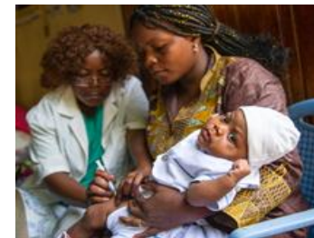
医療従事者によるワクチン投与

我が国は、2020年6月のグローバル・ワクチン・サミットでの当面3億ドル規模のプレッジのうち、1.3億ドル以上をCOVAXファシリティの事前買取制度(AMC)に拠出する(UHCフレンズ閣僚級会合(2020年10月)で発表)。※AMCはワクチン製造者に対し一定量を購入保証することにより途上国向けの製造・供給を促進する枠組み。