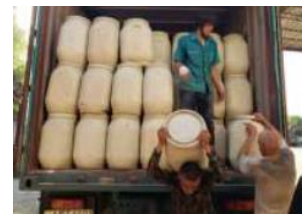
水道水消毒用塩素の配布(タジキスタン)

食料アクセスの阻害に伴う栄養不良や発育阻害の深刻化に関し、栄養改善に向けた分野横断的な取組を「栄養のアフリカ・イニシアチブ(IFNA)」を通じ アフリカの12か国 で実施。我が国は、 2021年12月に東京栄養サミットを開催 し、コミットメントと行動を促進する予定。