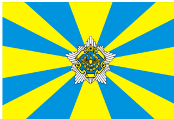
ธงประจำกองทัพอากาศของเบลารุส (ประกาศใช้ในปี 2001) https://www.mil.by/ru/encklop/heraldry/vvspvo/