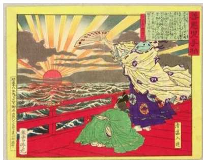
ภาพ “คิโยโมริ นิวาโด” จากภาพชุด “เซนอาคุโคโนะเทะกาชิวะ” โดย อาดาชิ กิงโด, 1885