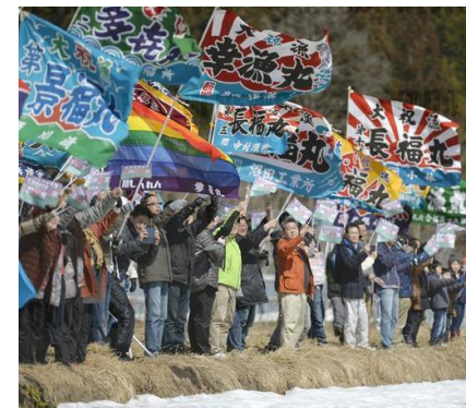
ผู้คนโบกธงอาทิตย์อุทัยเฉลิมฉลองการเปิดตัวรถไฟชินคันเซ็นสายฮอกไกโด