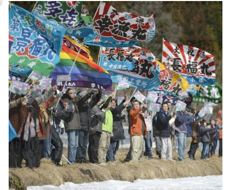
ผู้คนโบกธงอาทิตย์อุทัยเฉลิมฉลองการเปิดตัวรถไฟความเร็วสูงชินคันเซ็นสายฮอกไกโด (ภาพจากสำนักข่าวเคียวโด ปี ค.ศ. 2016)