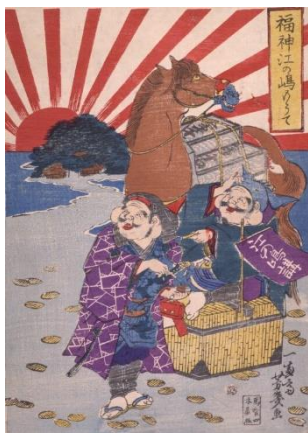
ภาพ “เทพนำโชคเยือนเกาะเอโนะชิมะ” โดย อาจิโอะ โยชิอิกุ, 1869

ชีวิตประจำวันของประชาชน และธงอาทิตย์อุทัย