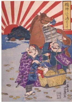
ภาพ “เทพนำโชคเยือนเกาะเอโนะชิมะ” โดย โออิ โยชิอิกุ, ค.ศ. 1869

ธงอาทิตย์อุทัย กับชีวิตประจำวันของประชาชน