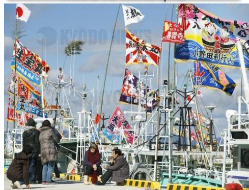
ธงไทรียวสำหรับเรือประมงปลิวไสวขณะที่เรือประมงอพยพเดินทางกลับเข้าฝั่ง (ท่าเรือประมงเอโคโตะ เมืองนามิเอะ จังหวัดฟุคุชิมะ)

ชีวิตประจำวันของประชาชน และธงอาทิตย์อุทัย