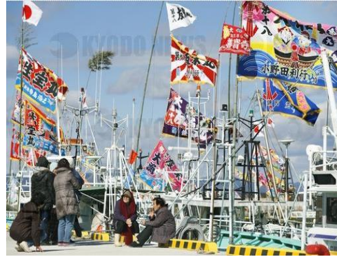
ธงไทรียวสำหรับเรือประมงปลิวไสวขณะที่เรือประมงเดินทางกลับเข้าฝั่ง (ท่าเรือประมงอุเคโตะ เมืองนามิเอะ จังหวัดฟุคุชิมะ)

ธงอาทิตย์อุทัย กับชีวิตประจำวันของประชาชน