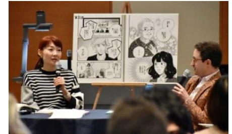
カルガリー大学での講演