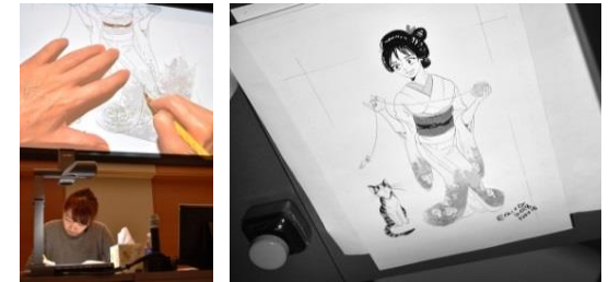
カルガリー大学での作画実演