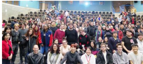
カルトン大学での講演