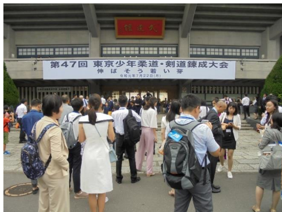
7月22日【テーマに関する視察】 日本武道館