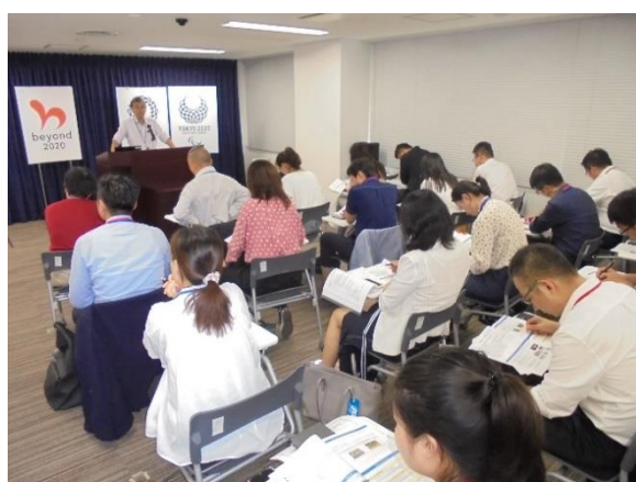
7月23日【テーマに関する講義】内閣官房 東京オリンピック・パラリンピック推進本部