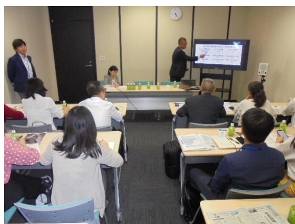
7月23日【メディア訪問】 (株)日本経済新聞社