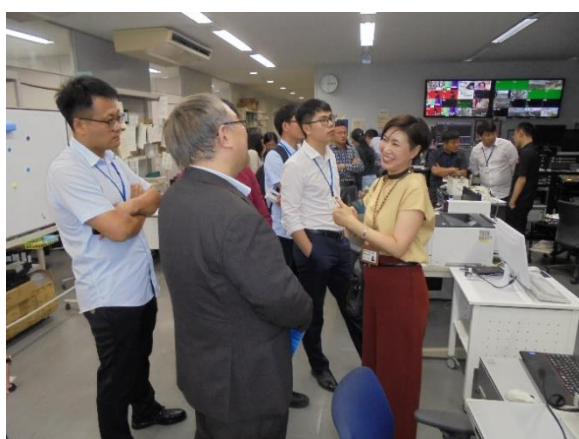
7月24日【メディア訪問】 信越放送(株)