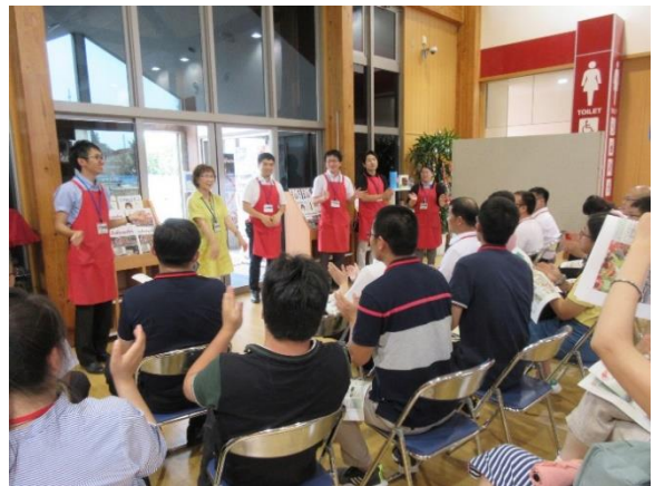
7月26日【テーマに関する視察】 道の駅十文字