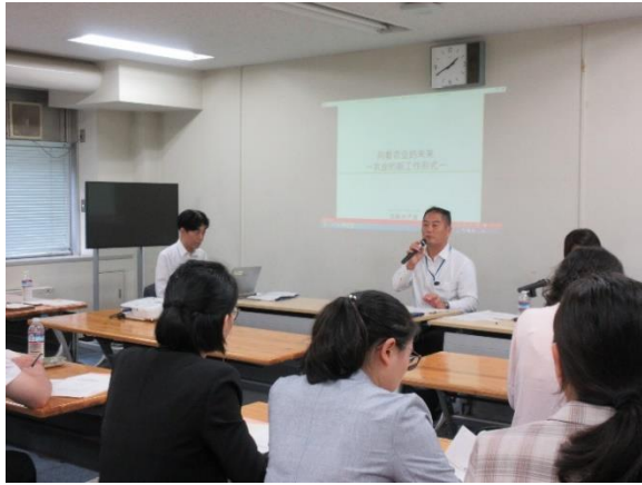
7月23日【テーマに関する講義】 農林水産省