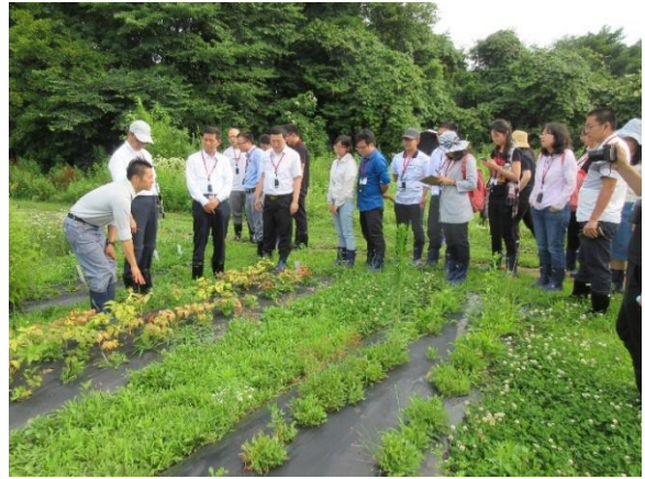
7月24日【テーマに関する視察】 (株)アルビオン白神研究所