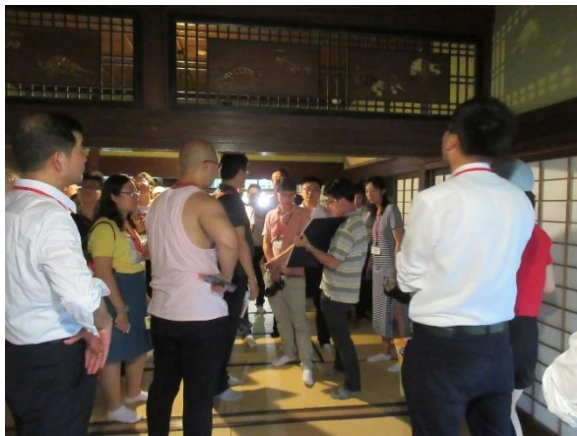
7月26日【見学】 角館武家屋敷