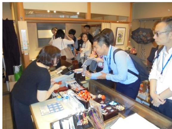
7月23日【自由取材】 神楽坂商店街