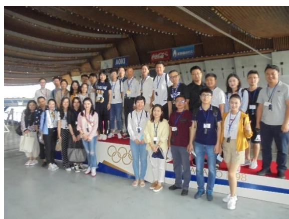
7月25日【テーマに関する視察】 エムウェーブ