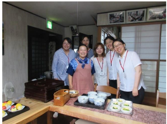
7月25日【体験】 ホームステイ（仙北市）