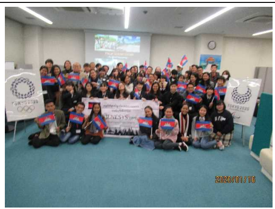
1月16日【学校・地域交流】 ホストタウン事業関係者との交流