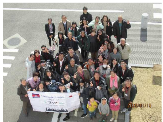
1月18日【ホームステイ】 そらの郷 山里物語