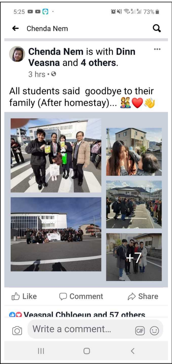
ホームステイ（そらの郷 山里物語）離村式についての発信