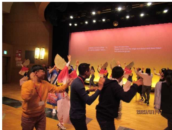
1月17日【文化体験】 阿波踊り体験(阿波おどり会館)