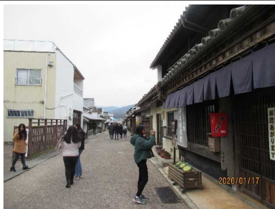
1月17日【視察】 うだつの町並み