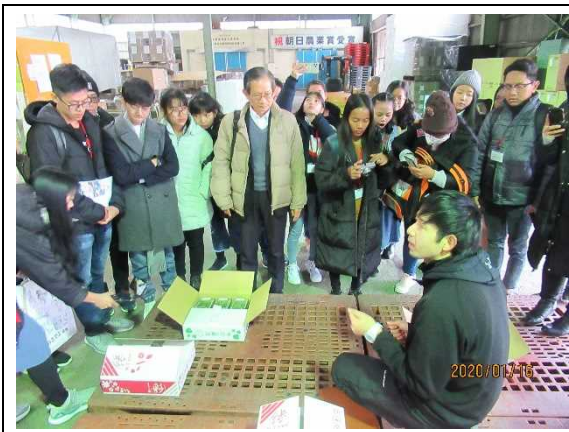
1月16日【視察】 上勝町(ゼロ・ウェイスト事業, 彩事業)