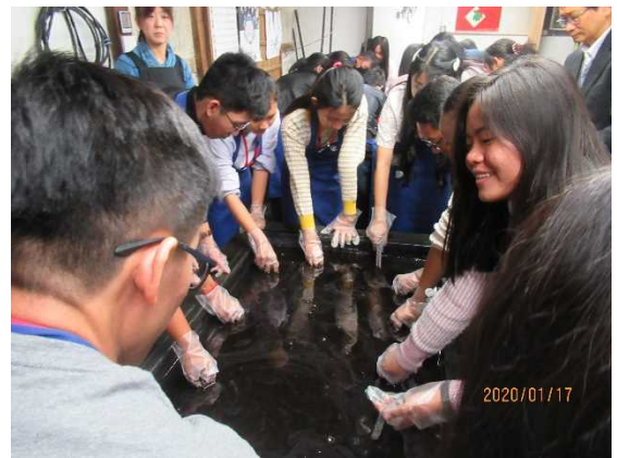
1月17日【文化体験】 藍染め体験(藍の館)