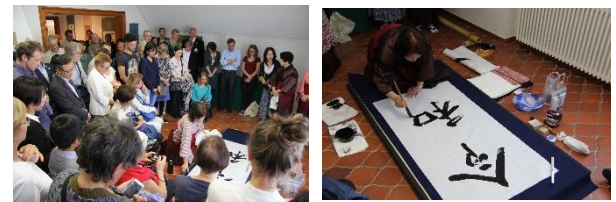
書道デモンストレーション