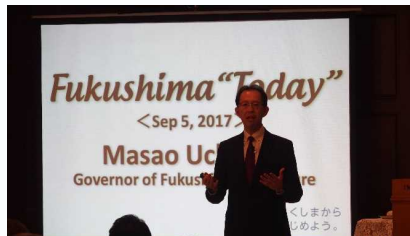
内堀知事のプレゼンテーション