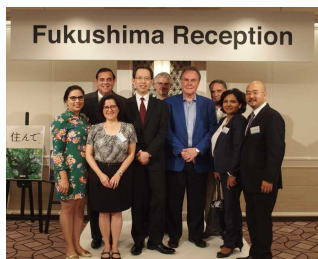
各国大使館関係者と知事の記念撮影

9月5日、福島県は都内のホテルにおいて「世界とのKIZUNA進化事業 福島復興セミナー・交流会」を開催しました。この事業は、これまでにアジア・大洋州地域、欧州地域の駐日外交団や国際機関等の方々を対象に実施され、今回は北米・中南米地域の駐日外交団や国際機関等の方々を対象に行い、多くの方が参加されたとのことです。 詳細