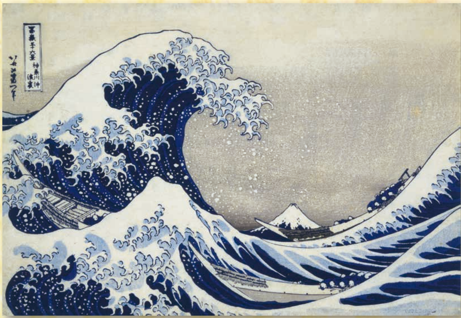
葛飾北斎 富嶽三十六景「神奈川沖浪裏」(山梨県立博物館蔵)