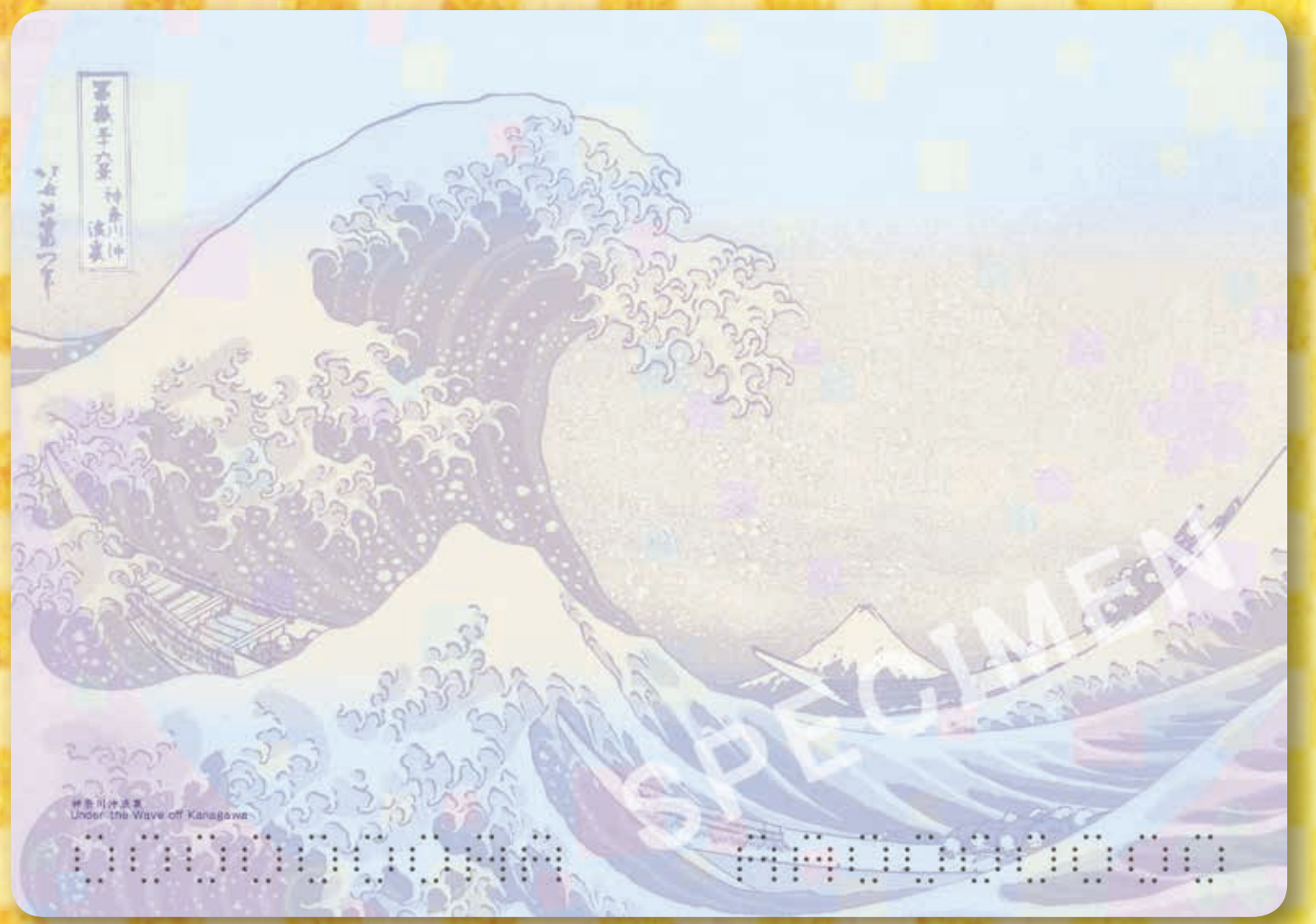
旅券になった富嶽三十六景「神奈川沖浪裏」