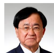
小林 喜光 KOBAYASHI Yoshimitsu