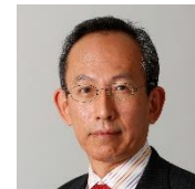
喜連川 優 KITSUREGAWA Masaru