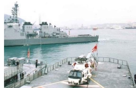
Revue navale internationale (Corée du Sud 1998) (Vaisseau de la Force maritime d'autodéfense dans le port de Busan)