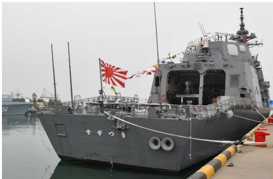
Revue navale internationale (Chine 2019) (Vaisseau de la Force maritime d'autodéfense dans le port de Qindao)