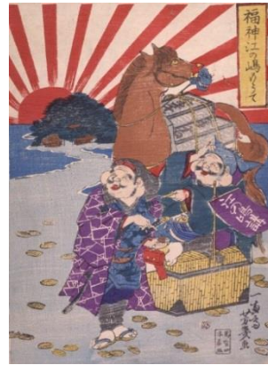
Les divinités du bonheur en visite à Enoshima, Yoshiiku Ochiai, 1869

Le drapeau du soleil levant dans la vie quotidienne