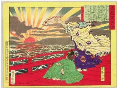
Le prêtre Kiyomori, d'après « Zen-aku ko no te gashiwa », Ginko Adachi, 1885