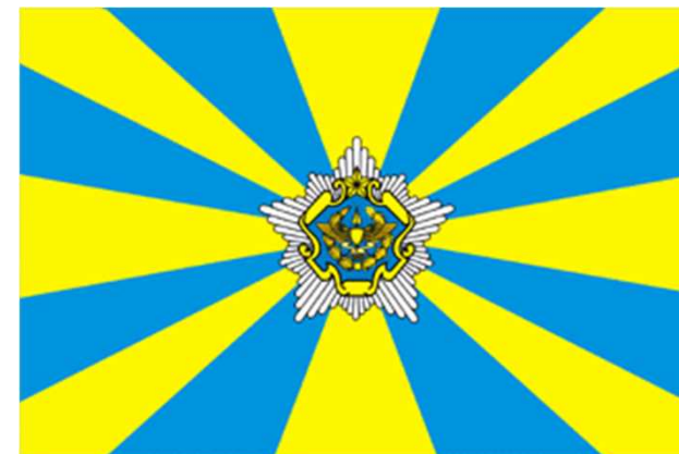
Drapeau de la Force aérienne biélorusse (2001-)

https://www.mil.by/ru/encklop/heraldry/vvspvo/