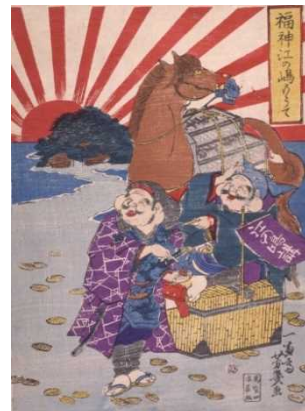
Les divinités du bonheur en visite à Enoshima, Yoshiiku Ochiai, 1869