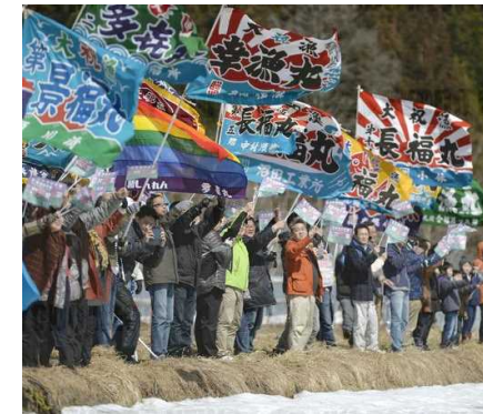
Foule célébrant la mise en service de la ligne Hokkaido Shinkansen avec des drapeaux de pêche abondante (2016)