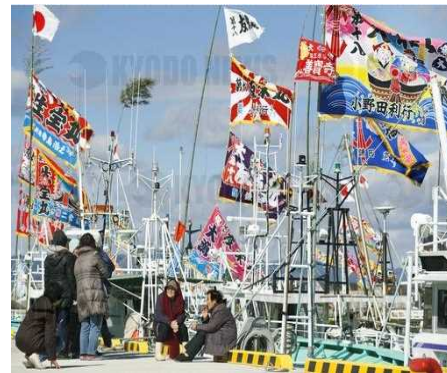
Retour au port de bateaux de pêches évacués après le Grand Séisme de l'Est du Japon arborant un drapeau de pêche abondante (port de pêche d'Ukedo, Namie-machi, préfecture de Fukushima)(2017)