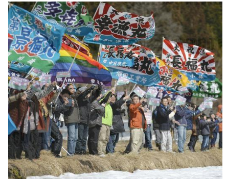
Foule célébrant la mise en service de la ligne Hokkaido Shinkansen avec des drapeaux de pêche abondante (2016)