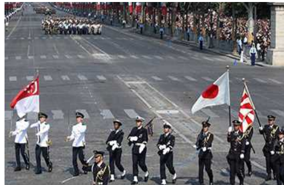
Défilé militaire à Paris (France 2018) (Unité de la Force d'autodéfense participant aux côtés de l'unité singaporeans)