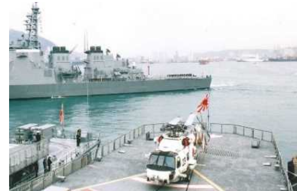
Revue navale internationale (Corée du sub 1998) (Vaisseau de la Force maritime d'autodéfense dans le port de Busan)