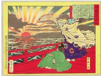
Le prêtre Kiyomori, d'après « Zen-aku ko no te gashiwa », Ginko Adachi, 1885

Le drapeau du soleil levant dans la culture japonaise