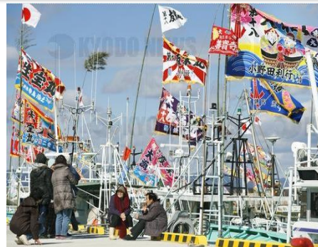
Retour au port de bateaux de pêches évacués après le Grand Séisme de l'Est du Japon arborant un drapeau de pêche abondante (port de pêche d'Ukedo, Namie-machi, préfecture de Fukushima)(2017)

Le drapeau du soleil levant dans la vie quotidienne