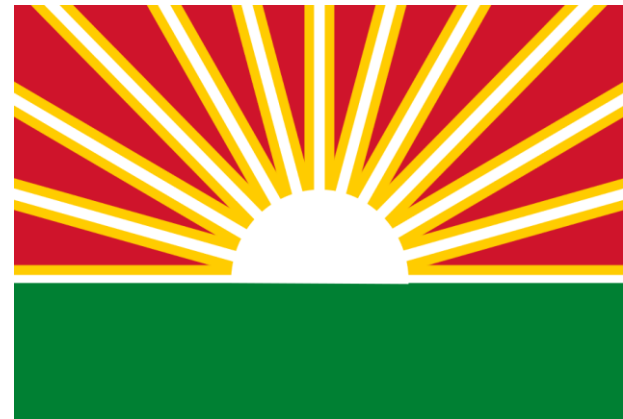
Bandera del estado de Lara, Venezuela (1901-)