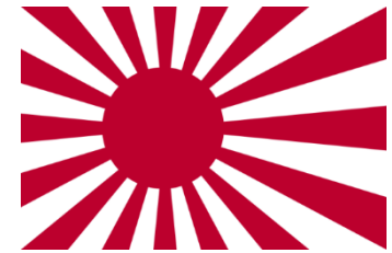
Bandera de la Fuerza Marítima de Autodefensa de Japón

Durante más de medio siglo, estas banderas han desempeñado un papel indispensable para mostrar la presencia de los buques y las unidades de las Fuerzas de Autodefensa, y son ampliamente aceptadas en la comunidad internacional.