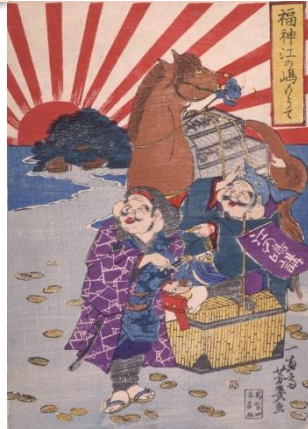
Una xilografía ukiyo-e : Los dioses de la Fortuna visitan el palacio de Enoshima , por Yoshiiku Ochiai, 1869