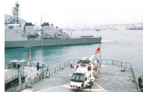
Desfile naval internacional (Corea del Sur 1998) (Buque de la Fuerza Marítima de Autodefensa en el puerto de Busan)