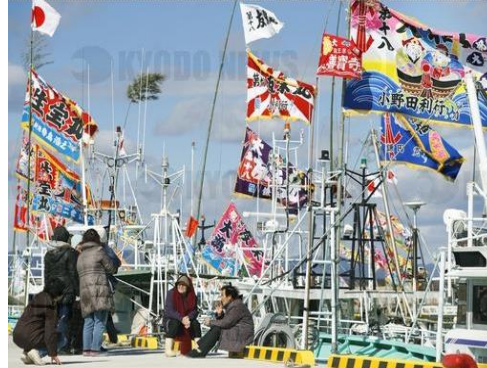
El regreso de los barcos pesqueros al puerto de Ukedo (2017), izando la bandera de pesca abundante, que habían sido evacuados debido al Gran Terremoto del Este de Japón