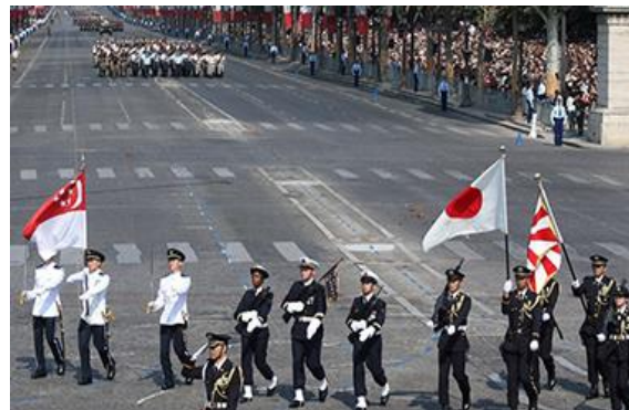
Desfile militar en París (Francia 2018) (Unidad de la Fuerza Terrestre de Autodefensa participando con el ejército de Singapur)