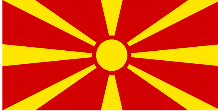
Bandera de la República de Macedonia del Norte (1995-)

El diseño del sol naciente con rayos de luz no es único ni exclusivo de Japón. Hay otros similares que se emplean universalmente, como se ve en la bandera nacional de la República de Macedonia del Norte, las banderas del estado de Arizona, Estados Unidos, y de Lara, Venezuela.