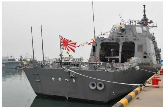
Desfile naval internacional (China 2019) (Buque de la Fuerza Marítima de Autodefensa en el puerto de Qingdao)