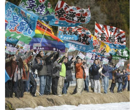
Gente celebrando la inauguración del tren bala Hokkaido Shinkansen con banderas de pesca abundante, 2016