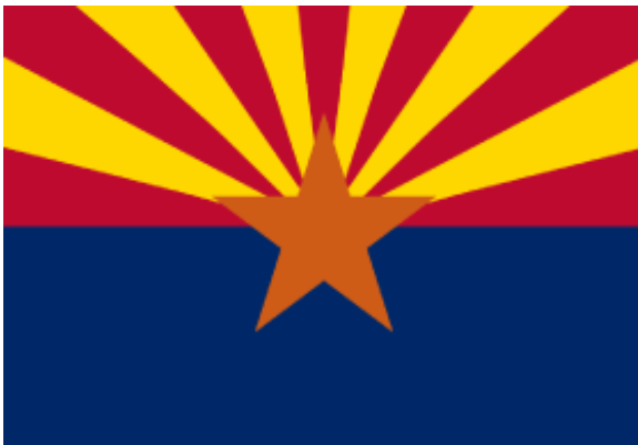
Bandera del estado de Arizona, EE. UU. (1917-)