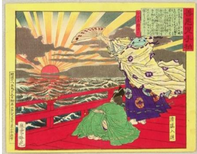
Monje Kiyomori , Una vieja historia de Kabuki, por Ginko Adachi, 1885