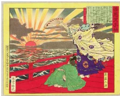
『善悪児手柏』より 「清盛入道」 安達吟光, 1885