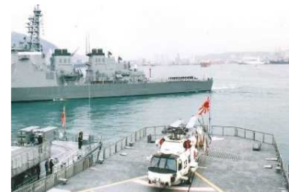
1998年 韓国で行われた国際観艦式に際し、 釜山港に入港した海上自衛隊の艦艇