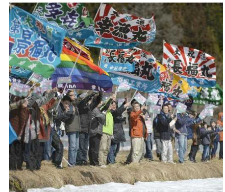
北海道新幹線の開通 を大漁旗で祝う人々 (2016年)