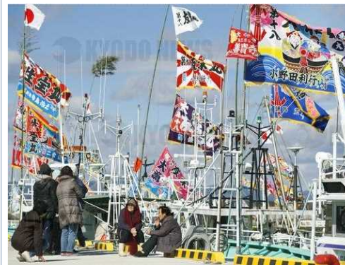
大漁旗を掲げながら 帰還する避難漁船 (福島県浪江町・請戸漁港) (2017年, 共同通信提供)