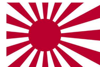
海上自衛隊 自衛艦旗

これらの旗は、これまで半世紀以上にわたり、自衛艦または部隊の所在を示すものとして、不可欠な役割を果たしてきており、国際社会においても広く受け入れられている。