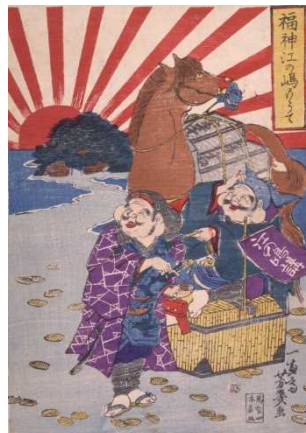
「福神江の嶋もうて」 落合芳幾, 1869