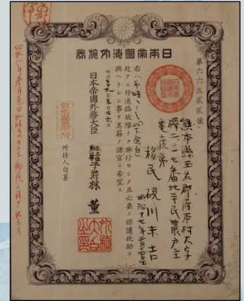
▶明治後半～大正時代の旅券 英・仏・中の3カ国の訳文が記載 されている