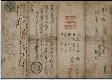
▶1866年(慶応2年) 海外渡航文書発給事務を開始