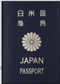
▶1992年(平成4年) 機械読取式旅券