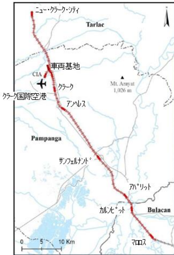
(北延伸区間) マロロス駅 - クラーク国際空港駅