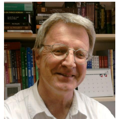
アンドレイ・ベケシュ