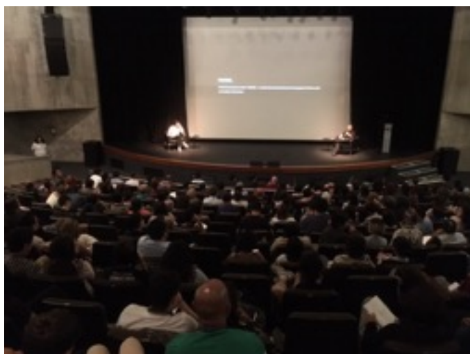
〈上：レクチャーの様子 右：配布パンフレット〉

Sescのアートとテクノロジーの専門講師をはじめ、アーティストやアートやデザインを専攻している学生約250人を対象に作品を中心とした自身の活動を紹介した。講演タイトルは「Material Sensation」。普段から彫刻表現として様々な素材を扱い、物質の持つ情報量の多さというものを実感している中で、物質やマテリアルから今の時代を感じてもらいたいとの思いからこのタイトルを選んだ。約1時間のレクチャーの後、作品のマテリアルなどについての質問を多く受けたのが印象的だった。様々な素材、技術の選択肢がある情報化社会の中で、アートとテクノロジーの繋がりやマテリアルの可能性を探りながらクリエイションを行う状況は、国境を超えても変わらないのだ、と感じた。