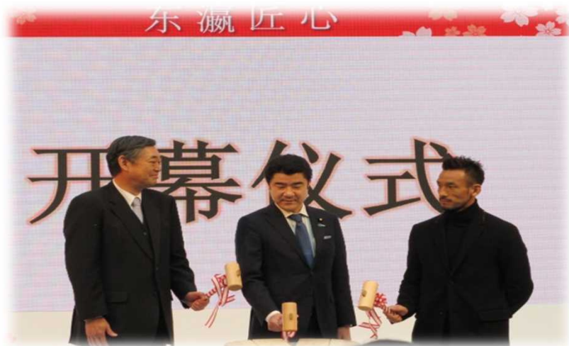
オープニングセレモニー