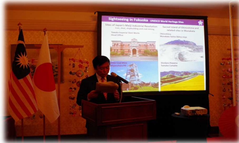
小川知事によるプレゼンテーション