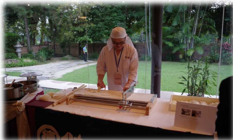
筑後うどんのデモンストレーション