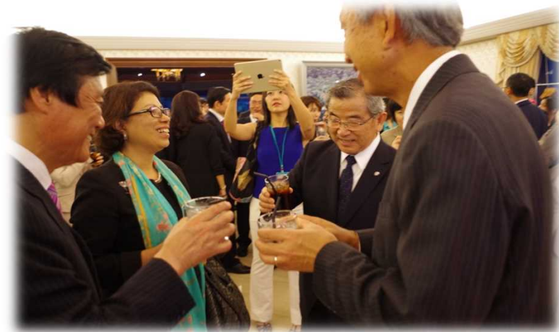
イベント会場の様子