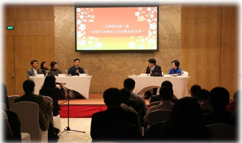
日本酒・日本食文化総合セミナー