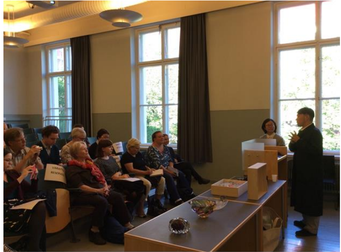
(レクチャーの様子)

続いて、翌9日には、ヘルシンキ市アンナタロ(文化施設)内講義室にて、江戸切子に関するレクチャーを開催し、友好団体関係者、大学生、一般市民の方が参加された。