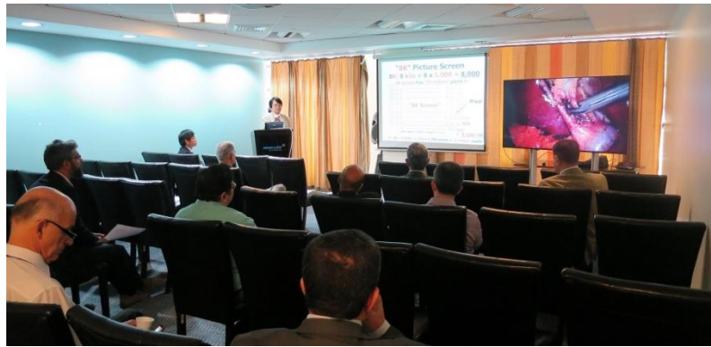
(MEDICLINIC CITY HOSPITAL でのプレゼンテーションの様子)

訪問先： Khaleej Times 社 (http://www.khaleejtimes.com/)