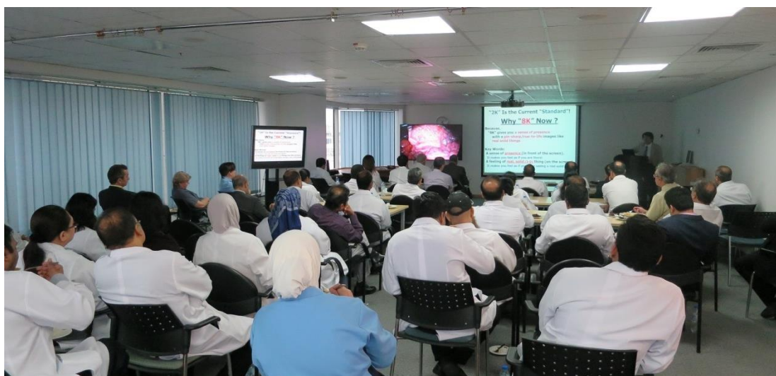
(MEDICLINIC WELCARE HOSPITAL でのプレゼンテーションの様子)