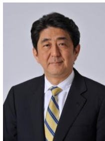
安倍晋三 内閣総理大臣