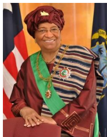
エレン・ジョンソン・サーリーフ リベリア大統領