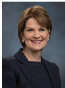
マリリン・ヒューソン ロッキード・マーティンCEO