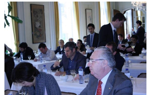
【講演・試飲会（ベルギー）】