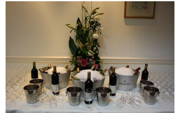
【試飲会で提供された日本産ワイン】

本件は、派遣先における日本産ワインの魅力を紹介する効果的な機会となるとともに、更にワイナリー間の国際交流開始に向けたきっかけ作りに貢献した。また、参加者からはワインの入手方法について多数照会がなされる等、対日理解のみならず日本産ワインの今後の海外普及にも寄与する事業となった。