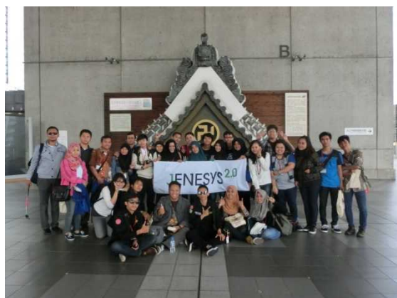
11月3日 江戸東京博物館 November 3, Edo Tokyo Museum