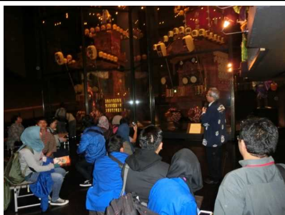
10月31日 市立川越祭り会館見学 October 31, National Important Intangible Folk Cultural Property