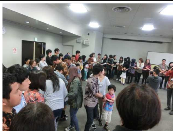
11月2日 ホームステイ先とのお別れ会 November 2, Farewell Party with Host Families