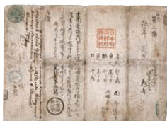
1866年(慶応2年)に発行された現存する最古の旅券(亀吉)

幕末以降の外交史に関心のある方は外交史料館に是非お越しください! 常設展示・特別展示も行っていますのでお見逃しなく!