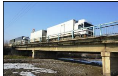
(頻繁に通行する大型トレーラー)