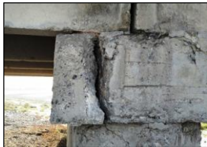
(崩壊寸前の橋脚台座部)