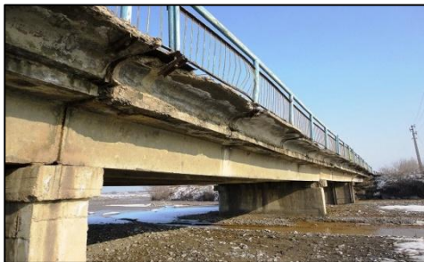
(損傷・老朽化が著しい橋梁)