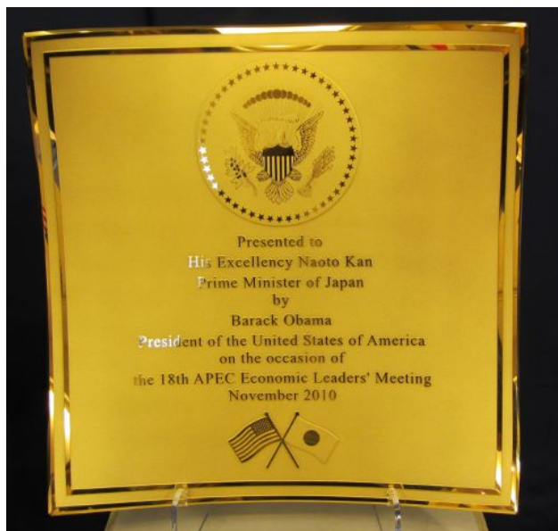
日米の国旗をあしらったAPECのプレート