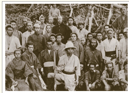
一時期は古賀村という村ができるほど、多くの日本人が生活していた