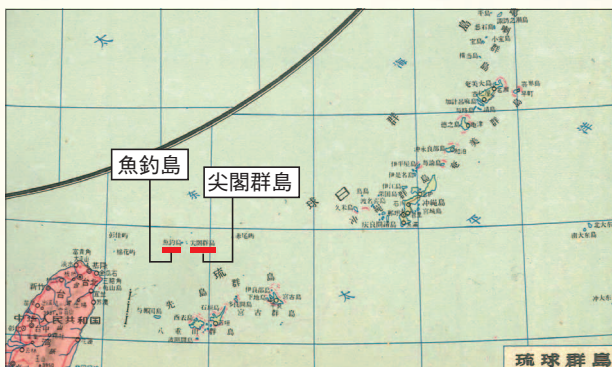
1958年に中国の地図出版社が出版した『世界地図集』 「尖閣諸島」を「尖閣群島」と明記し、沖縄の一部として取り扱っている