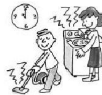
吸塵器或洗衣機的聲音