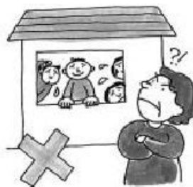
將房屋轉租給他人。