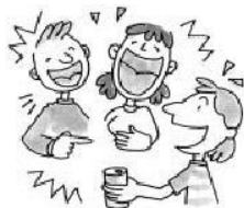
聚會時的大聲說笑與大音量的音樂