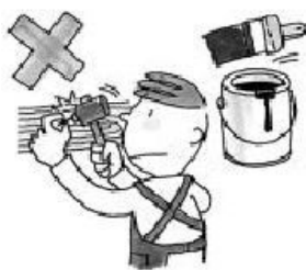
在房屋內釘釘子、塗油漆。

未經屋主許可，承租人不可對房屋進行增建改造或內部裝修，不可與非家庭成員同住。當然，也不能把房屋的一部分或全部再轉租給其他人。