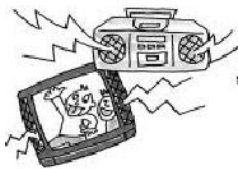
電視、收音機、揚聲器的聲音