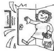
用力開門關門時的聲音