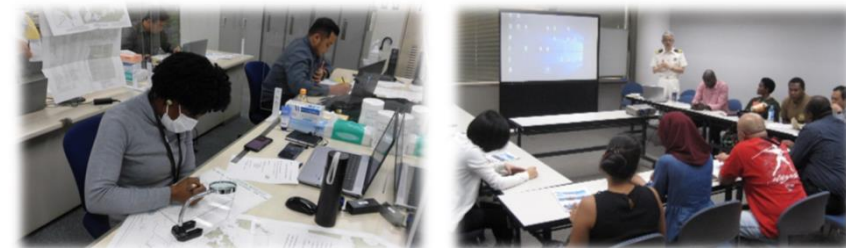
能力構築支援における研修の様子。