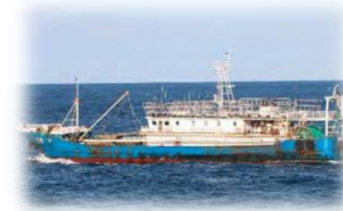
I U U漁業船として報告されている漁船の一例。