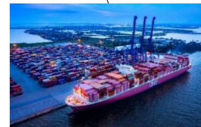
コンテナターミナル