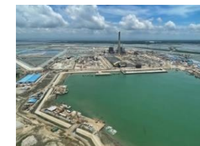
マタバリ深海港(バングラデシュ)