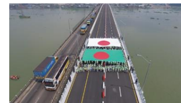
メグナ第2橋(バングラデシュ)