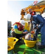
トルコ： 防災教育プロジェクト