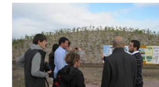
アジア防災センター 客員研究員 (東日本大震災被災地)