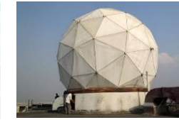
バングラデシュ： 気象レーダー整備