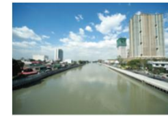
フィリピン： 河川改修