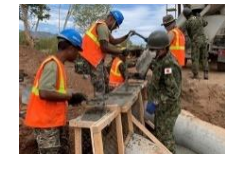
東ティモール： 土木