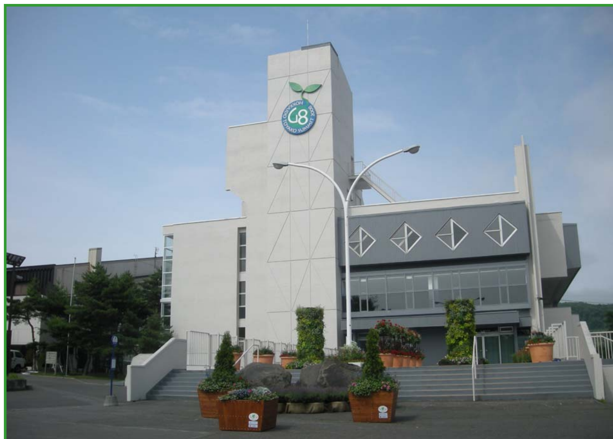
北海道洞爺湖サミット外務省現地事務所跡(旧火山科学館)