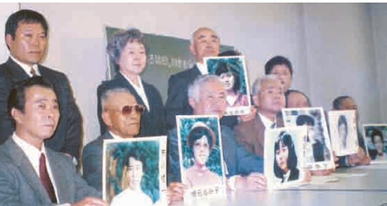
被北朝鲜绑架受害者家属联络会（家属会）成立

北朝鲜之所以进行“绑架”这一前所未有的国家犯罪行为，是有它的深刻背景的。比如，有的是为了使特工人员冒名顶替被绑架者进行活动，有的是让被绑架者担任特工人员的辅导员，以便把特工人员训练成日本人，还有的绑架是为了获得人才而由隐藏在北朝鲜的“淀