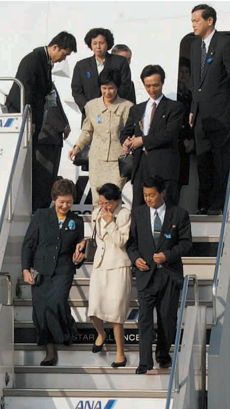
时隔24年回国的绑架受害者