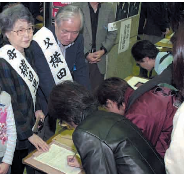
由“家属会”开展的签名活动