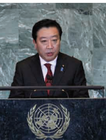
野田总理在联合国大会一般性辩论上发表讲话 (2011年9月)

(3) 在韩国也有很多遭北朝鲜绑架的受害者，此外根据回国的日本绑架受害者等的证词表明，在泰国、罗马尼亚、黎巴嫩也存在具有被北朝鲜绑架可能性的人。此外，根据从北朝鲜回来的韩国人绑架受害者等的证词表明，也有中国等国家的绑架受害者。绑架问题已经成为在国际社会具有普遍性的人权问题。2011年3月在联合国的人权理事会上，连续第4年通过了以延长北朝鲜人权状况特别调查员的授权等为主要内容的决议，并在2011年12月的联合国大会上，表示出对包括绑架问题在内的北朝鲜人权状况的严重关切，并以历史上最多的赞成票（123票），连续7年通过了要求北朝鲜改善人权状况的《北朝鲜人权状况决议》。联合国北朝鲜人权状况特别调查员马尔祖基在2011年的报告中，与前任的蒙丹蓬北朝鲜人权状况特别调查员一样，劝告北朝鲜应该为解决绑架问题及早作出有效的合作行动。另外，马尔祖基北朝鲜人权状况特别调查员于2011年1月和2012年1月访问日本，并与政府等有关人士交换了意见。