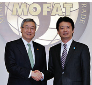
日韩外长会谈（2011年10月）

另外，在与美国、中国、韩国等各国举行的首脑会谈和外长会谈等场合，各国也都对日本在绑架问题上的立场表示出理解和支持。在2011年11月举行的日美外长会谈上，玄叶外务大臣就美国在美朝对话中提到绑架问题表示感谢，美国国务卿希拉里·克林顿指出，每次在与北朝鲜协商时，都提到绑架问题，要求北朝鲜采取行动。