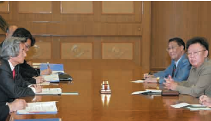
第二轮日朝首脑会谈（2004年5月22日）