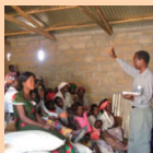
Vulgarisateur menant un suivi