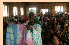
Ikaram (Nigeria) : formation à l'autonomisation des femmes