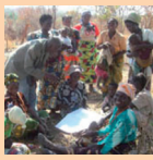
Groupe de femmes formulant un plan d'action

Il s'agit d'une approche participative destinée au développement durable des villages appuyée par des fonds et une aide technique mise à disposition par le Japon. Des fonds de capital d'amorçage sont utilisés pour être réinvestis dans des microprojets communautaires afin d'améliorer la qualité de vie des villageois. Un total de 130 000 personnes réparties dans 170 villages a bénéficié de la phase pilote du projet qui s'est achevée en décembre 2009. Il sera élargi afin de couvrir un plus grand nombre de villages.