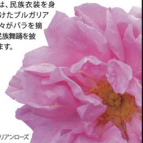
ブルガリアンローズ

ブルガリアの特産品の一つに、香料用のバラがあります。5月から6月の開花の時期にはバラ祭りが開催され、数多くの観光客が訪れます。バラ祭りでは、民族衣装を身につけたブルガリアの人々がバラを摘み、民族舞踊を披露します。