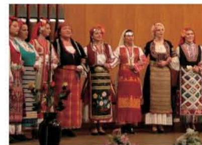
ブルガリアン・ボイス