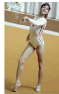
ナディア・コマネチ

ルーマニア北部のモルドヴァ地方には、15～16世紀に建設された内壁だけでなく外壁までが聖像画（イコン）のフレスコ画によって埋め尽くされた修道院が集中しており、「5つの修道院」として有名です。西欧ゴシック様式とヴィザンチン様式の折衷様式によって建てられたこれらの修道院は、ユネスコの世界文化遺産に登録されているものもあります。