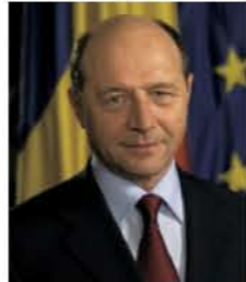
トリアン・バセスク大統領 ルーマニア・日本交流年名誉総裁

雄大な自然や中世の街並みなどの世界遺産と、南東欧地域には珍しいラテン系の気さくで温かい国民性を有するルーマニアは、日本の重要な友好国の一つです。ルーマニアと日本は、2009年に外交関係再開50周年を迎えます。2007年にEU加盟国となったルーマニアと日本は、今後もあらゆる面で協力関係の更なる進展が期待されます。