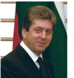
ゲオルギ・パルヴァノフ大統領 ブルガリア・日本交流年名誉総裁

ブルガリアは古代から文明と民族の十字路口に位置し、雄大な歴史を誇る国です。そのブルガリアと日本は、2009年、外交関係再開50周年を迎えます。両国はこれまで、お互いの歴史、文化を尊重しながら、伝統的に大変友好的な関係を築いてきました。2007年にEU加盟国となったブルガリアと、更に活発な協力関係を構築していくことが期待されます。