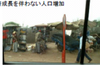
ダカールのインフォーマル経済の様子