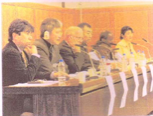
パネリスト・ファシリテーター