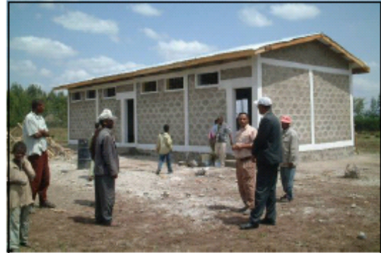
現地NGOが建設しているコミュニティ・スクール (East Shewa Zone, Oromiya Region)

成功例: 政府は、NGOの穀物銀行等貯蓄・貸付アプローチを、現在開発プログラムに取り入れている。