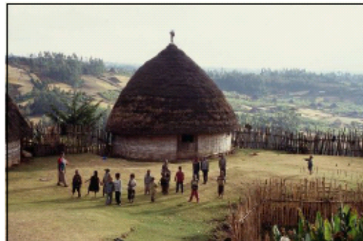
地方の村落 (Gura Zone, Southern Region)