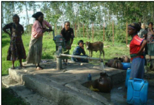
水を汲む女性 (Gurage Zone, Southern Region)