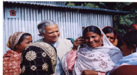
2006 Nobel Peace Laureate Prof. Md. Yunus with Grameen Bank members