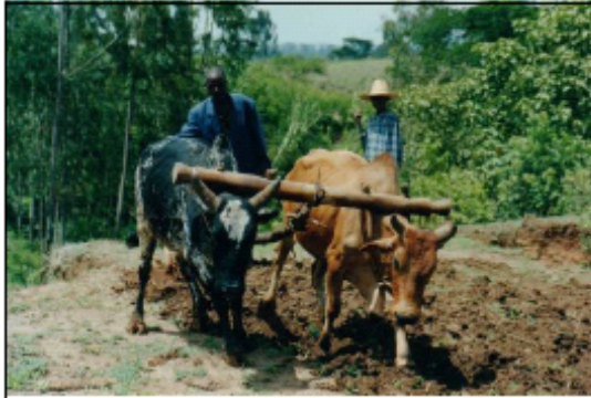
伝統的な牛による耕作 (Site Zone, Southern Region)