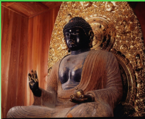
木造薬師如来坐像 千百年前建立