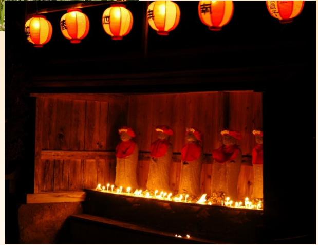
平和な生活を見守る 六地蔵(地蔵菩薩)