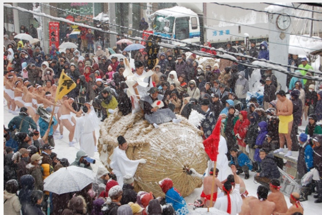
2010年 大雪の中の冬祭り(初市) -15