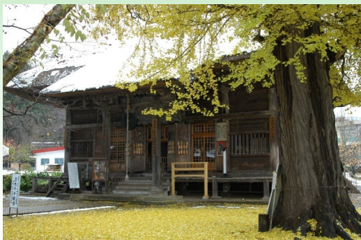
立木観音堂 八百年前建立