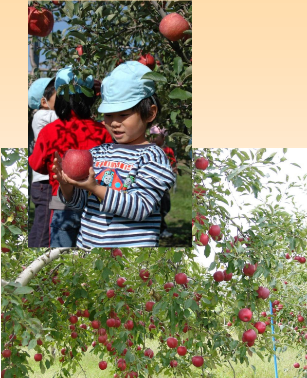
たわわに実ったリンゴ農園