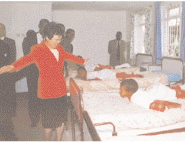
草の根無償が行われているエチオピアのポリオ療養院を視察する川口外務大臣

2001年における日本の二国間援助の地域別実績では、アジアが56.6%(前年54.8%)、アフリカ11.4%(前年10.1%)、中南米9.9%(前年8.3%)、中東3.9%(前年7.5%)となっており、アジアが最大