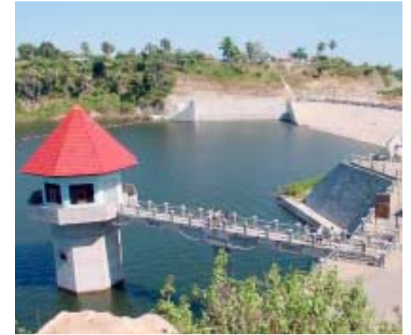
円借款によってできた東マサトゥンガラ州初の本格的ダム(インドネシア)

1997年のアジア通貨・経済危機により、アジア諸国の経済成長が大きな打撃を被ったのは記憶に新しいところです。しかし、これまで多くの円借款を行い一定の国内開発が進んでいたアジア諸国だけに、その後のすばやい立ち直りと平均的な成長の高さは、日本の円借款のメリットが最大限生かされたものといえるでしょう。