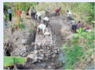
簡易堰により灌漑農業がうまくいっている地区において、取水堰を練り石積みタイプのものにアップグレード

また、小規模灌漑の導入により、乾季に栽培ができるようになり、収入が増え、太陽光パネルの設置、子どもの学費補充、自宅の屋根をトタンにするなど、小規模農民の生活が改善するという具体的な成果も出ています。（2016年8月時点）