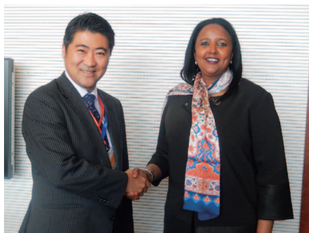
2016年1月、第28回AU閣僚執理事会出席のためエチオピアを訪問した木原前外務副大臣は、アミナ・ケニア外務・国際貿易長官（2016年5月の組織改編で、現在、外務長官）と会談した

TICAD VIでは、2013年に開催されたTICAD V以降のアフリカの開発をめぐる環境変化（特に国際資源価格の下落、エボラ出血熱の流行、テロ・暴力的過激主義の台頭）を踏まえ、①経済多角化・産業化を通じた経済構造改革の促進、②質の高い生活のための強靱な保健システム促進、③繁栄の共有のための社会安定化について集中的な議論が行われ、その成果として、