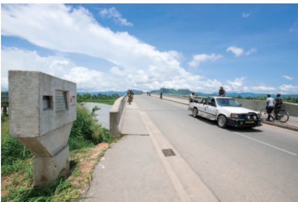
マラウイ南部のマングチ県に無償資金協力で整備されたマングチ橋。モザンビークを経由するナカラ回廊の物流の活性化に役立つ。

日本政府は、TICAD VIの取組として、2016年から2018年の3年間で、日本の強みである質の高さ（クオリティ）を活かした約1,000万人の人材育成（エンパワーメント）をはじめ、官民総額300億ドル規模の質の高いインフラ整備や強靱な保健システム促進、平和と安定の基盤づくりなどのアフリカの未来への投資を行う旨を発表しました。また、この取組は、G7伊勢志摩サミットの成果を実践する第一歩であり、日本の優れた科学技術・イノベーション力を活かしつつ、G7議長国として着実にその成果を実現する旨を表明しました。