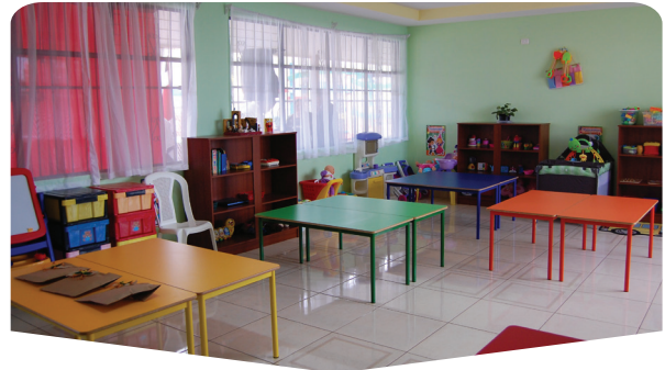
AÑO:: 2013 Proyecto de Ampliación de Centro de Educación y Nutrición (CEN) de Cipreses (Oreamuno, Cartago) (Educación/Salud)