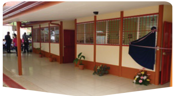
AÑO:: 2011 2011. Proyecto de Construcción de Aulas de Primaria en la Escuela de Excelencia Tayutic (Turrialba, Cartago) ( Estudio / Educación / Asistencia para la Comunidad Indígena)