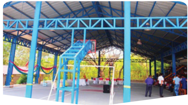
AÑO:: 2012 Proyecto de Construcción de Salón Multiuso para la Escuela Julia Acuña Somarribas (Liberia, Guanacaste) (Estudio/Educación)