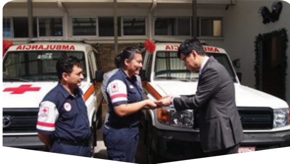
AÑO:: 2013 Proyecto para la Adquisición de Ambulancias para los Comités Auxiliares de la Cruz Roja Costarricense (Paquera, Puntarenas / Pococí, Limón, / Hojancha) (Salud / Atención Médica)