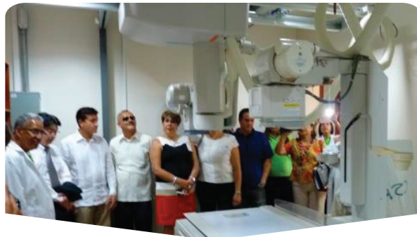
AÑO:: 2012 Proyecto de Dotación de Equipos Médicos a la Clínica San Rafael (Puntarenas, Puntarenas) (Salud/Atención Médica)