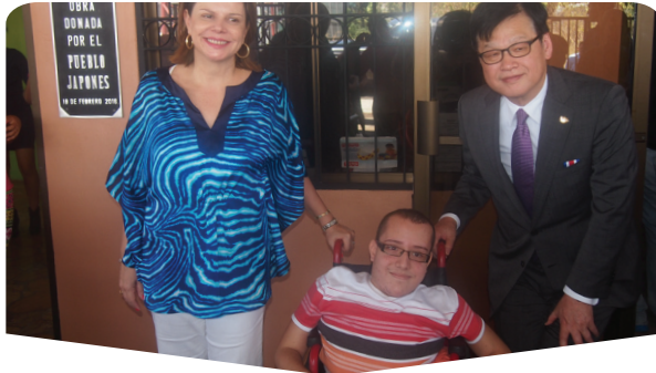
AÑO:: 2013 Proyecto de Construcción de Centro de Atención para Personas con Discapacidad en el Cantón de Orotina (Orotina, Alajuela) (Estudio/Educación/Asistencia para las Personas con Discapacidad)