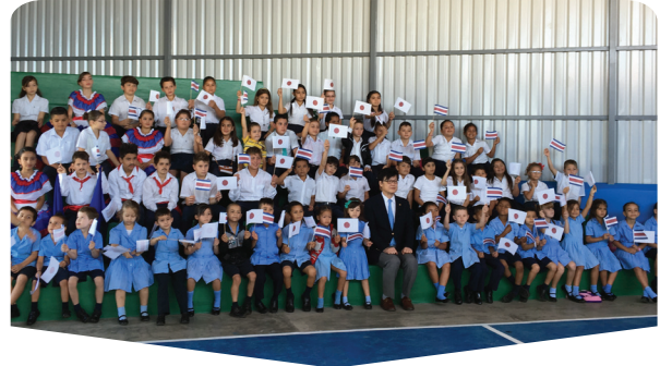
AÑO:: 2013 Proyecto de Remodelación de la Escuela San Luis (Grecia, Alajuela) (Estudio/Educación)