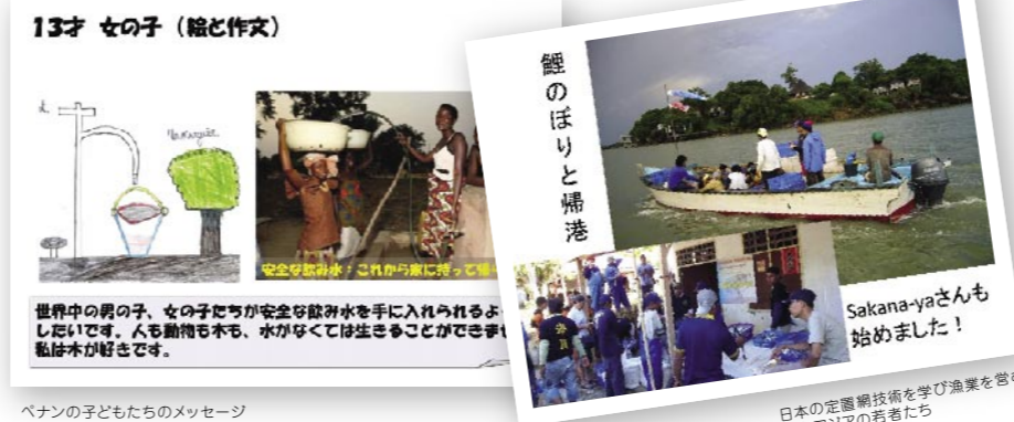
ベナンの子どもたちのメッセージ