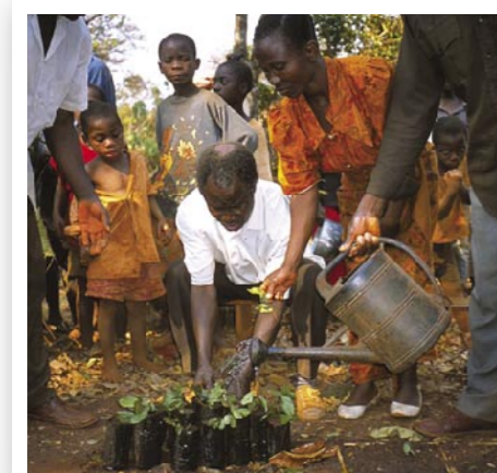
2009年の入賞作品 | 苗木に水をあげるタンザニアの人たち