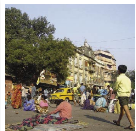
2009年の入賞作品 | インド・コルカタの路上で暮らす人々