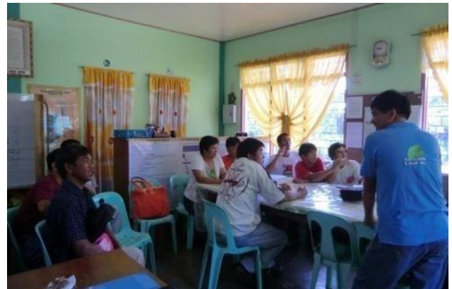
有機・減農薬生産規定研修にて質疑応答を行う対象生産者(左)と現地有機農業専門家(右)