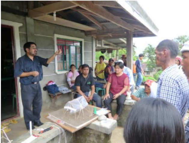
日本人専門家による、ビニルハウス建設研修