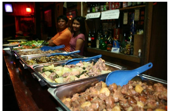
試食会で提供された、有機野菜を使った料理