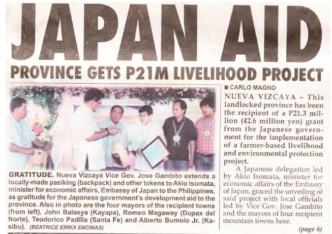
事業開始式典と事業についての地元新聞の記事