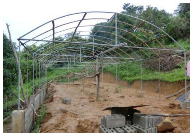
ビニルハウスの建設(ドウパックス・デル・スール町カ ナバイ村)