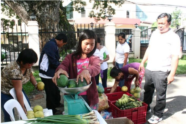
対象州都で開催された有機農産物の直販会