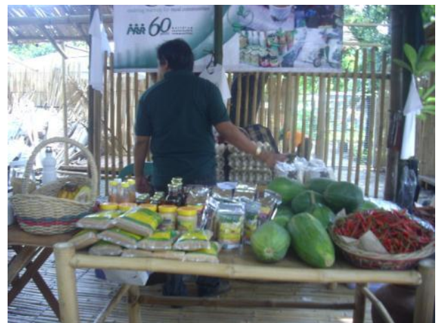
有機・自然派製品青空市に開設した、現地提携 NGO の販売所