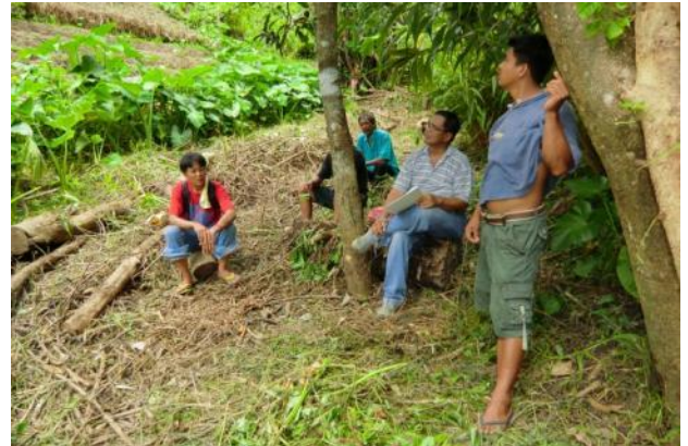
有機農業専門家による農場視察(サンタ・フェ町)