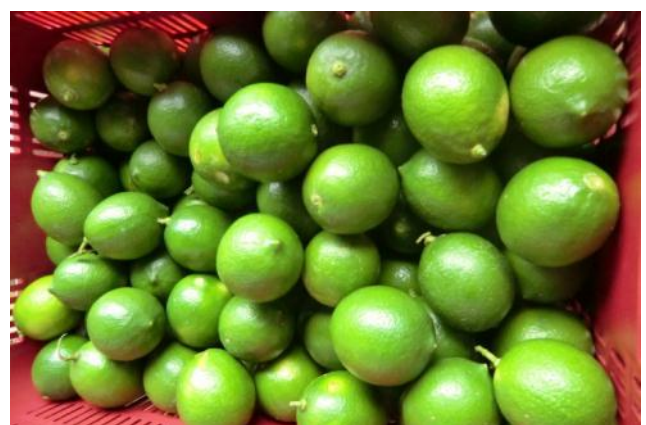
事業対象生産者が有機栽培したレモン、マニラで有機農産物を個人宅配するバイヤーへの初出荷