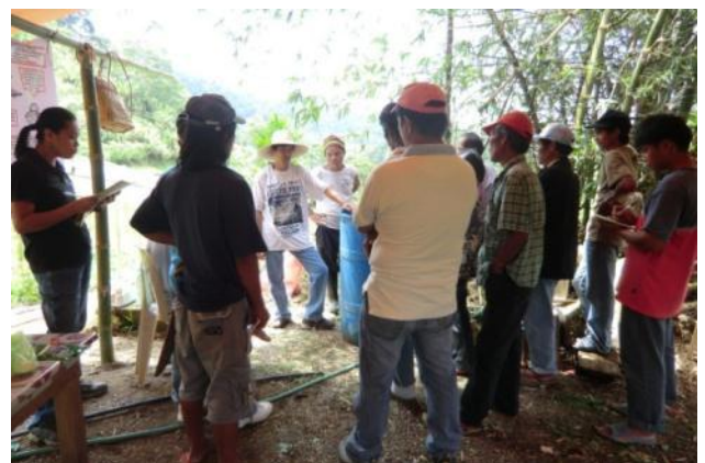
有機肥料・農薬製造研修にて、有機液肥の原料とな る土着の微生物を増やす方法を実演(カシブ町アント ウトット村)