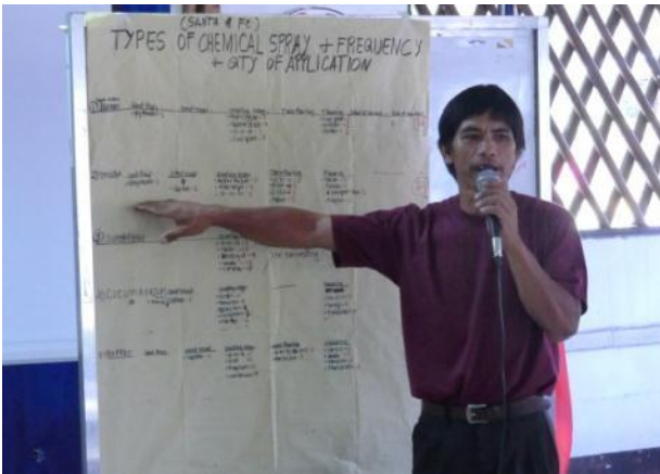
減農薬生産規定研修にて使用している農薬の種類と頻度を発表する対象生産者(サンタ・フェ町)