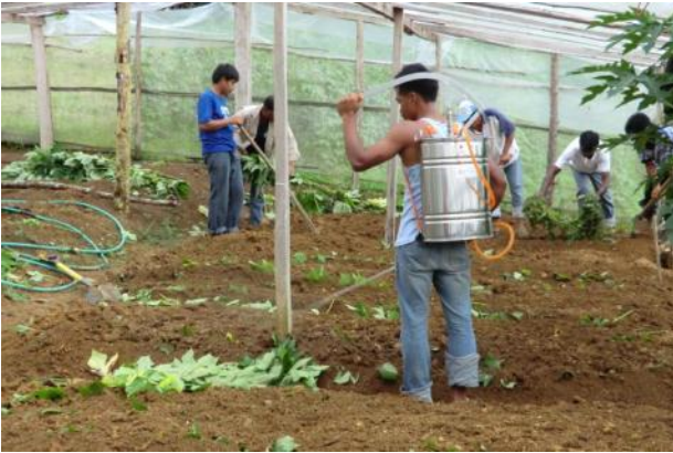
ビニルハウス栽培研修にて、鋤き込んだ緑肥に植物発酵液を吹きかける対象生産者(カシブ町アントゥートット村)