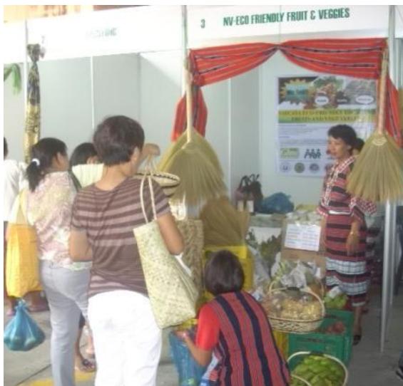
現地提携 NGO 主催の有機・自然派製品販売会 にて有機農産物など販売、広報