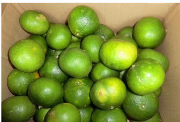
事業対象生産者が有機栽培したサツمامカン、マニラ で有機農産物を個人宅配するバイヤーへの初出荷