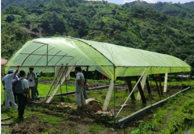
建設されたビニルハウス(カヤパ町ティダン・ビレッジ村)