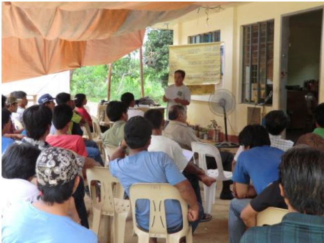
住民対象の事業説明会(ドウパックス・デル・スール 町カナバイ村)