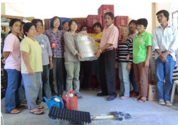
農機具の供与(カヤパ町ピンキアン村)