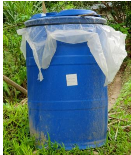
配布されたプラスチック容器を使い、研修で学んだ方法で植物発酵液を製造(カシブ町アントゥートット村)