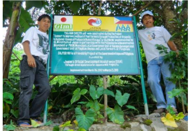
ビニルハウス表示板(カヤパ町ティダン・ビレッジ村)