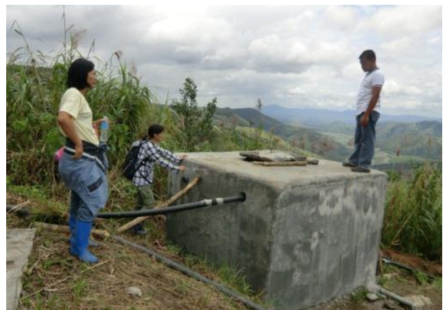
建設された貯水タンク(サンタ・フェ町バクネン村)