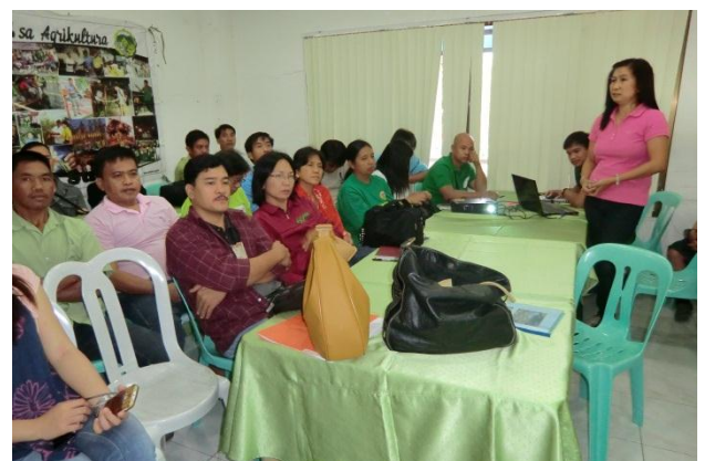
州外研修にて、参加型有機認証制度を導入したケソン州の州農業担当官から説明を受ける参加者