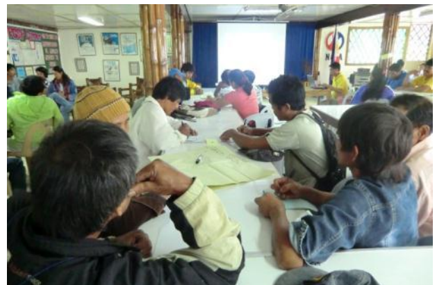
対象生産者を対象に開催された参加型有機認証制度オリエンテーションにて、グループワークを行う対象生産者