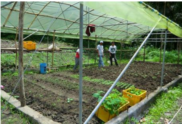
野菜栽培の始まったビニルハウス(カヤバ町ピンキアン村)