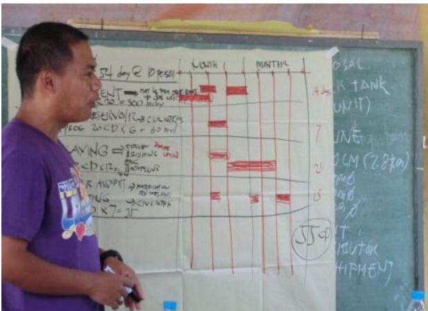
小規模灌漑施設建設に関する住民説明会で建設計画を説明する町の技術官(サンタ・フェ町バクネン村)