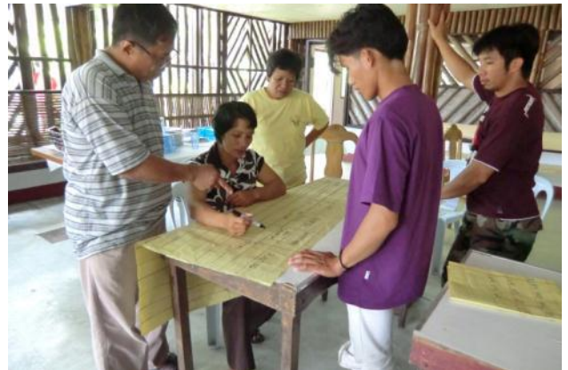
現地有機農業専門家による栽培計画策定研修にて グループワークを行う参加者と助言する専門家(左)