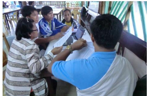
第2回目の参加型有機認証制度研修にて、制度施行のマニュアル草稿を作成する参加者