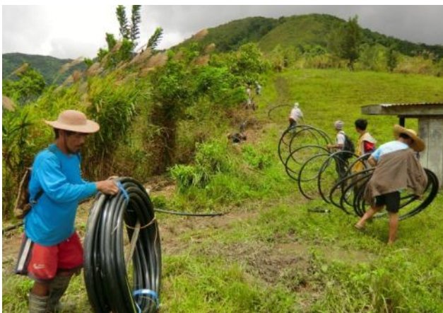
小規模灌漑施設の建設(サンタ・フェ町バクネン村)