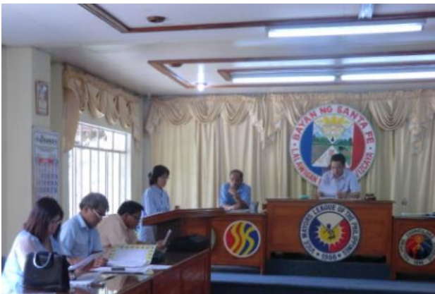
町議会対象の事業説明会(サンタ・フェ町)