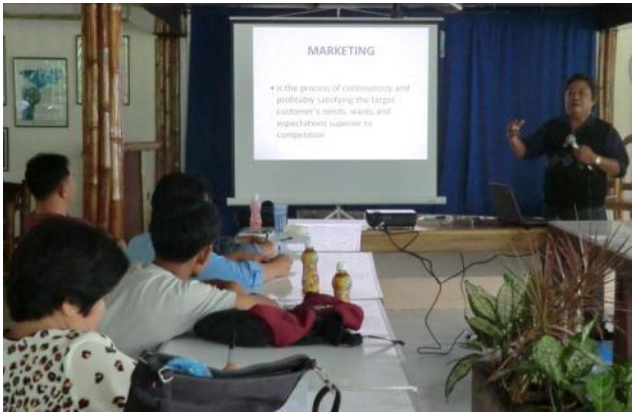
ビジネス研修(第1回目)