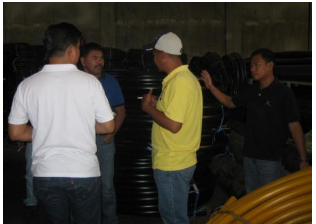
小規模灌漑施設建設資材の品質確認を行う町の技術官