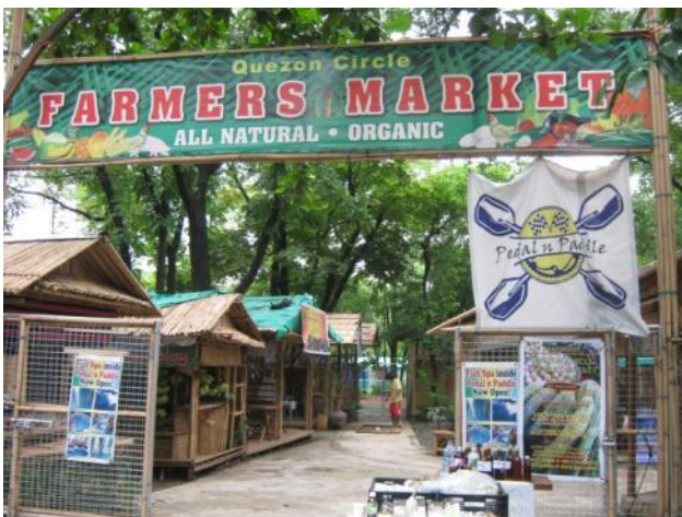
マニラ・ケソンサークルに設置された、有機・自然派 製品青空市