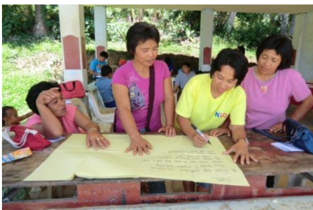
農機具管理ワークショップにて、農機具使用規則をリ スト化する対象生産者(カシブ町マカロン村)