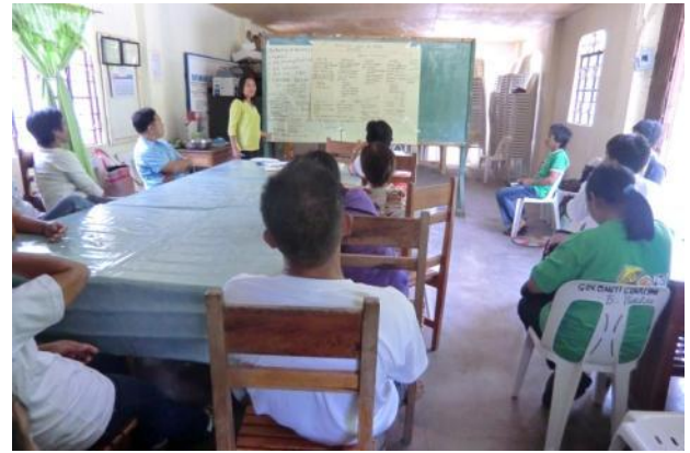
販売における課題を共有、改善策を検討する生産者 会議(カヤパ町ピンキアン村)