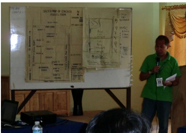
第3回目の参加型有機認証制度研修にて、農場査察の練習を行った後、査察結果を発表する参加者