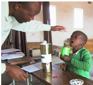
「学校保健」教育の風景 (ジンバブエ)