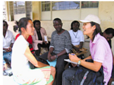
予防啓発活動を移動式で展開するJOCV隊員 (ケニア)