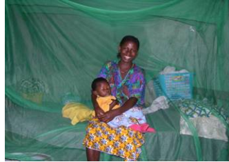
殺虫剤浸潤蚊帳を使うシエラレオネの親子