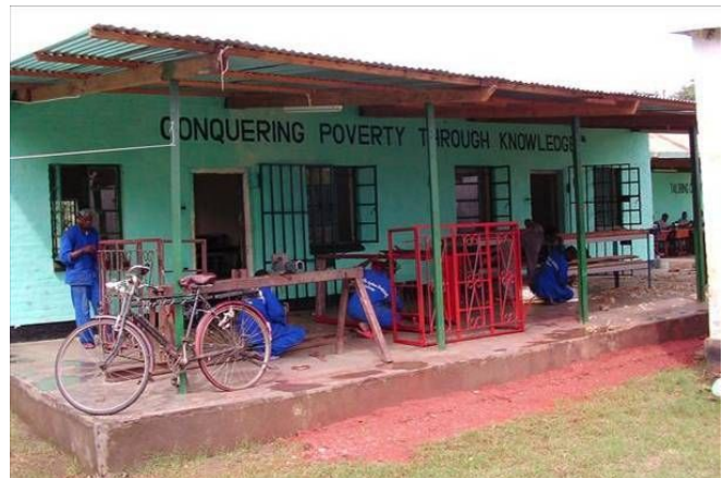
<知識をもって貧困を制する-エイズ孤児たちのための職業訓練所>