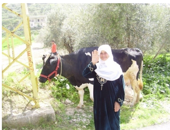
<不発弾除去後の安全な農地での住民組織による復興事業を支援>