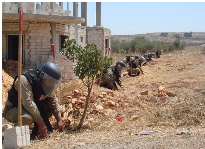
<訓練された地元青年たちの手により、不発弾の除去が進められた>

クラスター弾を除去するために、二つの爆発物処理チームが任命され、対象コミュニティにおいて除去活動を実施した。2008年6月時点では、これらのチームにより約56万平方メートルの安全が確保され、10のコミュニティにおいてクラスター弾323個、不発弾9個が破壊された。爆発物除去後の活動として、コミュニティ住民はコミュニティ活動計画を実施するための協同組合を組織した。本事業は、コミュニティ参加アプローチを通じて組織メンバーの計画立案と実施能力の強化を図っている。