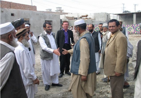
<コミュニティの復興に力を合わせる>

コミュニティ参加を促進し地域の連帯感を醸成するため、コミュニティには街づくり協議会を組織した。住環境を改善するためのコミュニティ活動計画の実施により、雇用が創出された。街づくり協議会の活動の結果、道路、上下水道、ゴミ収集、教育、保健サービスなど通常の市の行政サービスを受けられるようになった。本プロジェクトの実施により、脆弱な人々の生活環境は大幅に改善されている。