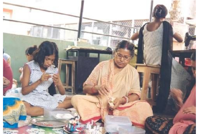
人身取引被害にあった少女たちに手に職をつけさせ自立を支援する。 (インド、)

が行われ、潘国連事務総長、チャン WHO 事務局長、緒方 JICA 理事長、シェッティ・アムネ스티・インターナショナル事務局長等が参加し、人間の安全保障の有用性・意義・普及に向けた課題等につき話し合いが行われた。人間の安全保障はグローバルな課題に取り組む際の指導理念として益々注目されるようになっている。