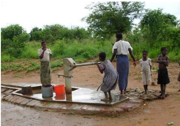
<井戸は村民の健康状態を改善し、水汲み労働を軽減>

職人たちは訓練で身につけたよりよい知識と技術で農具を製作し、その製品は農業の生産性の改善に貢献している。また孤児たちの将来のために、プロジェクトでは職業訓練を行い、必要な道具を提供した。女性のための収入獲得活動は、脆弱な家計の貴重な収入源となっている。2006年から2008年までの収益はおよそ5万米ドルであり、本プロジェクトは貧困克服のチャンスをもたらしている。