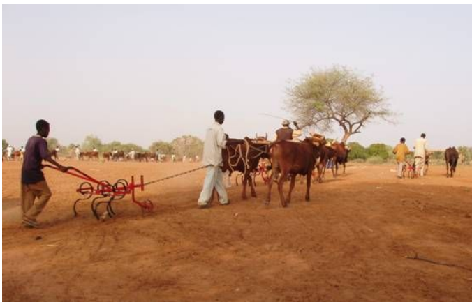
村の鍛冶工が製作した農機で農作物の生産性向上を目指す。 (スーダン、写真提供: UNIDO)