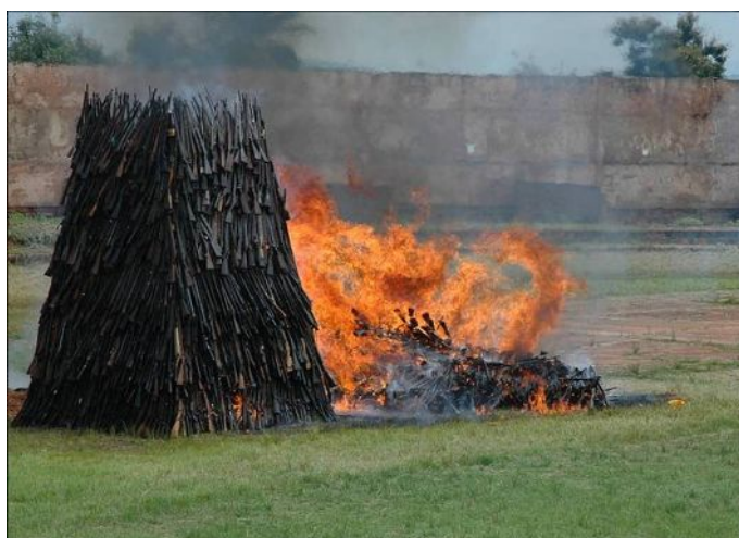
小型武器の回収・撲滅イベントを通じて、地域の安定に対する人々の意識の変革を促す。