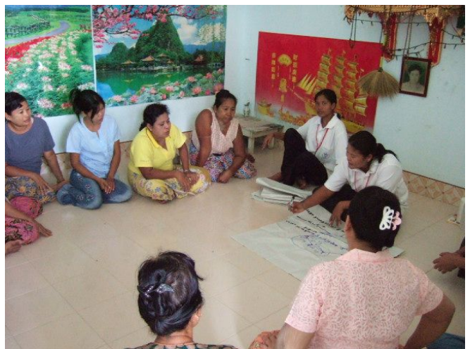
ミャンマーからの移住者コミュニティの健康促進のため、コレラや保健に関する知識を普及させる。

この観点から、人間の安全保障基金は、イヤーマーク付きの拠出を認めないが、ドナーは、事業の支援に当たり、関心を有する地域及び分野並びにそれらの優先順位を表明することができる。