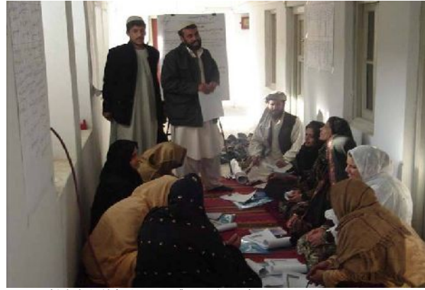
<女性たちも積極的に街づくりに参加する>