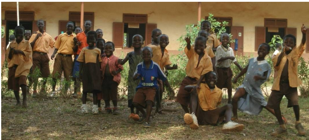
＜ガーナ・ボンサリ村の子供たち＞