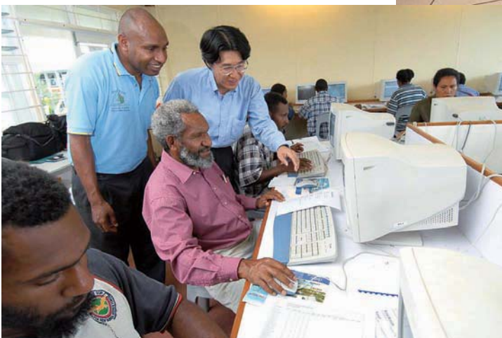
バブアニューギニア派遣、青年海外協力隊隊員（職種：システムエンジニア） （3月）