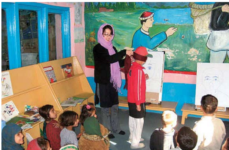
アフガニスタン・ナンガルハール県の県都ジャラバード市で運営する子ども図書館にて活動する（社）シャンティ国際ボランティア会の日本人スタッフ（平成18年度日本NGO支援無償資金協力事業）

※GII：「人口・AIDSに関する地球規模問題イニシアティブ（Global Issues Initiative on Population and AIDS）」の略。 IDI：「沖縄感染症対策イニシアティブ（Okinawa Infectious Diseases Initiative）」の略。1994年度開始時には「GIIに関する外務省・NGO懇談会」という名称だったが、2000年7月のG8九州・沖縄サミットにおいて日本が発表した「沖縄感染症対策イニシアティブ」を受け、「GII/IDIに関する外務省・NGO懇談会」という名称になった。