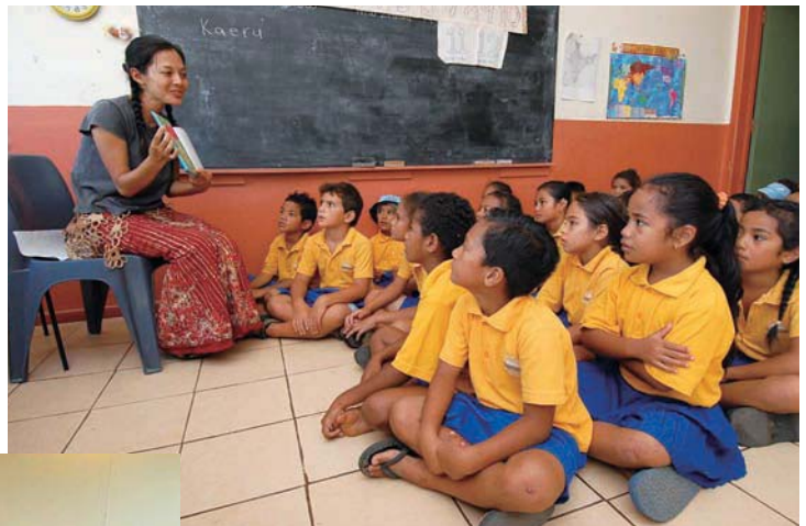
トンガ派遣、青年海外協力隊隊員（職種：小学校教諭） （3月）

また、協力隊やボランティア参加者は帰国後その経験を教育の現場やコミュニティレベルで共有するなど、様々な形で社会に還元しており、そのユニークな活動は受入れ国をはじめ国内外から高い評価を得ている。