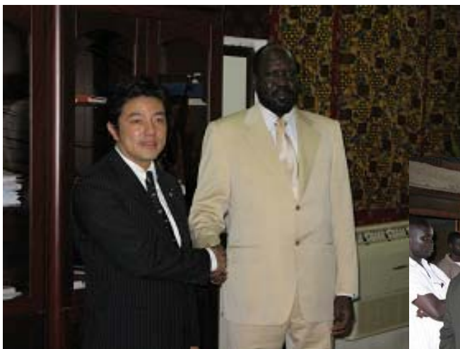
サルヴァキール南部政府大統領

(2) また、ジュバ訪問中に行われた中山政務官とサルヴァキール南部スーダン政府大統領との会談は我が国政府高官としては初めてであり、我が国の対南部スーダン支援に対する揺るぎないコミットメントを示した。更にジュバ視察を通じ、治安は概ね落ち着いており、各種の復興事業が立ち上がりつつある南部スーダン地域の実情を把握することができた。