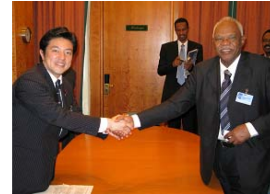
アルジャーズ財務大臣