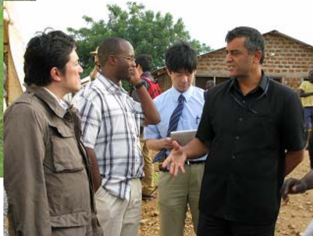
UNHCR帰還民受入れ現場