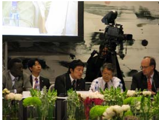
午後のセッションでの共同議長