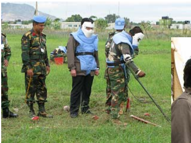
地雷除去デモンストレーション

(ロ)また、中山政務官は、UNMISのジュバ駐屯地を視察し、UNMISの活動状況につきブリーフィングを受けると共に、バングラデシュ軍による地雷除去活動を視察した。更に滞在中、我が国支援による事業(JICA、NGO、国連機関(UNHCR、WFP)事業)を視察。