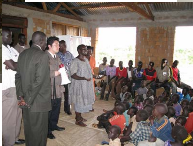
ウガンダからの帰還民