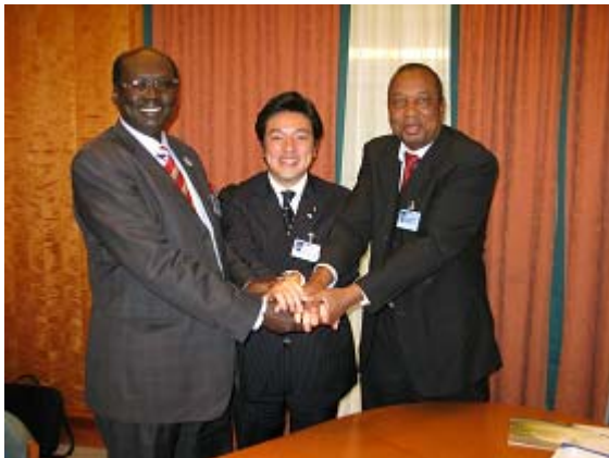
ベンジャミン地域協力大臣他