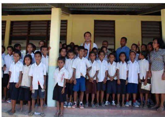
ディリ郊外の学校視察