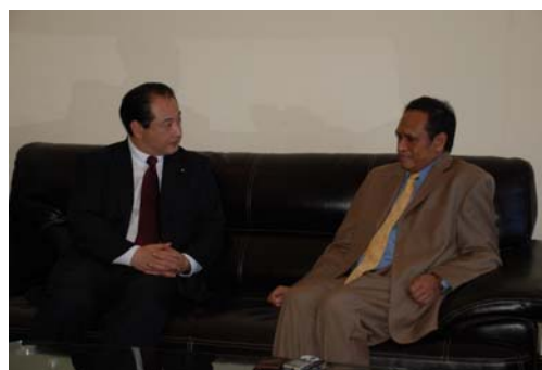
グテーレス副首相への表敬訪問