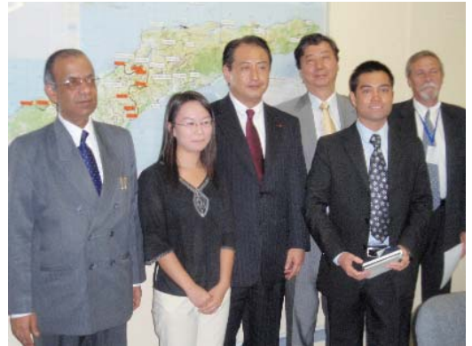
カレ UNMIT 特別代表表敬 (UNMIT 邦人職員と記念撮影)