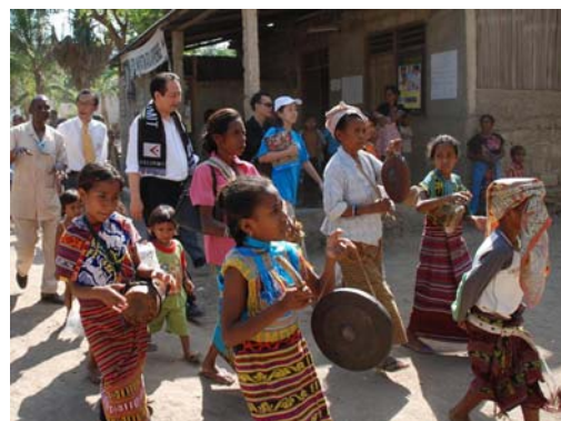
王子ネピア・プロジェクト視察 村人から踊りで歓迎