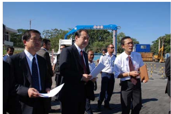
日本支援のディリ港改修現場視察