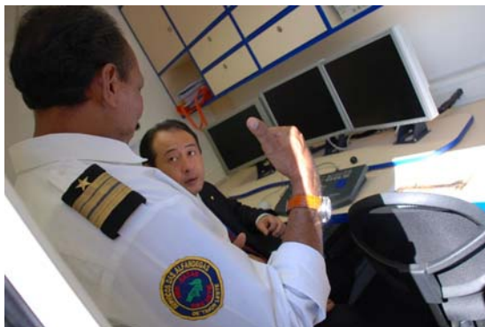
日本支援のカーゴX線機械視察