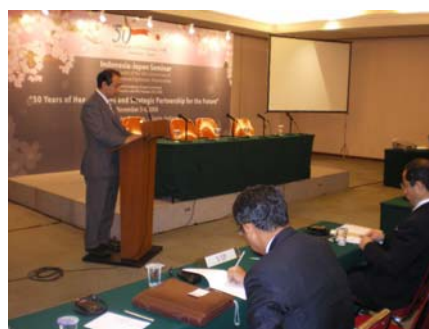
セミナーでのスピーチ