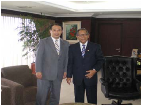
ギナンジャール地方代表議会議長との会談