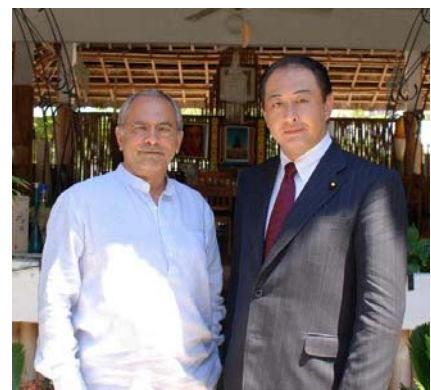
ラモス・ホルタ大統領への表敬訪問