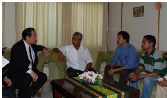
ダ・コスタ外務大臣との会談 (ダ・シルバ・インフラ大臣、 サビノ農水大臣同席)