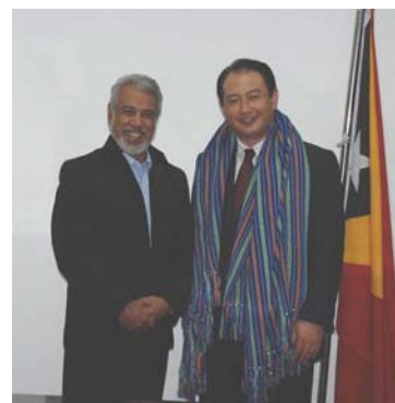
グスマン首相への表敬訪問

(注) 東ティモールで唯一の国際港であるディリ港は、近年貨物の取扱量が飛躍的に増大しており、同機械の導入により税関